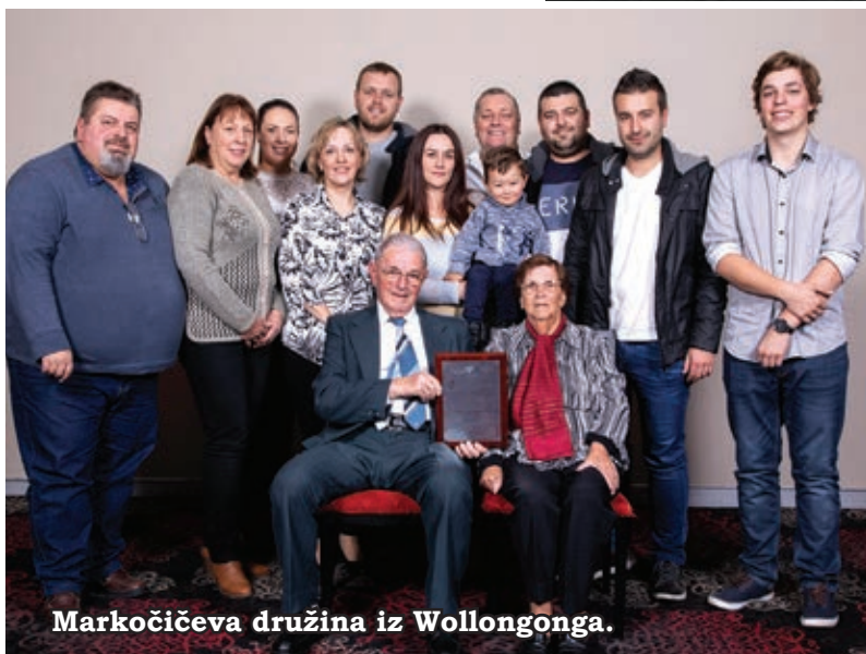
Markočičeva družina iz Wollongonga.