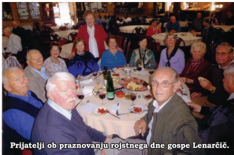
Prijatelji ob praznovanju rojstnega dne gospe Lenarčič.