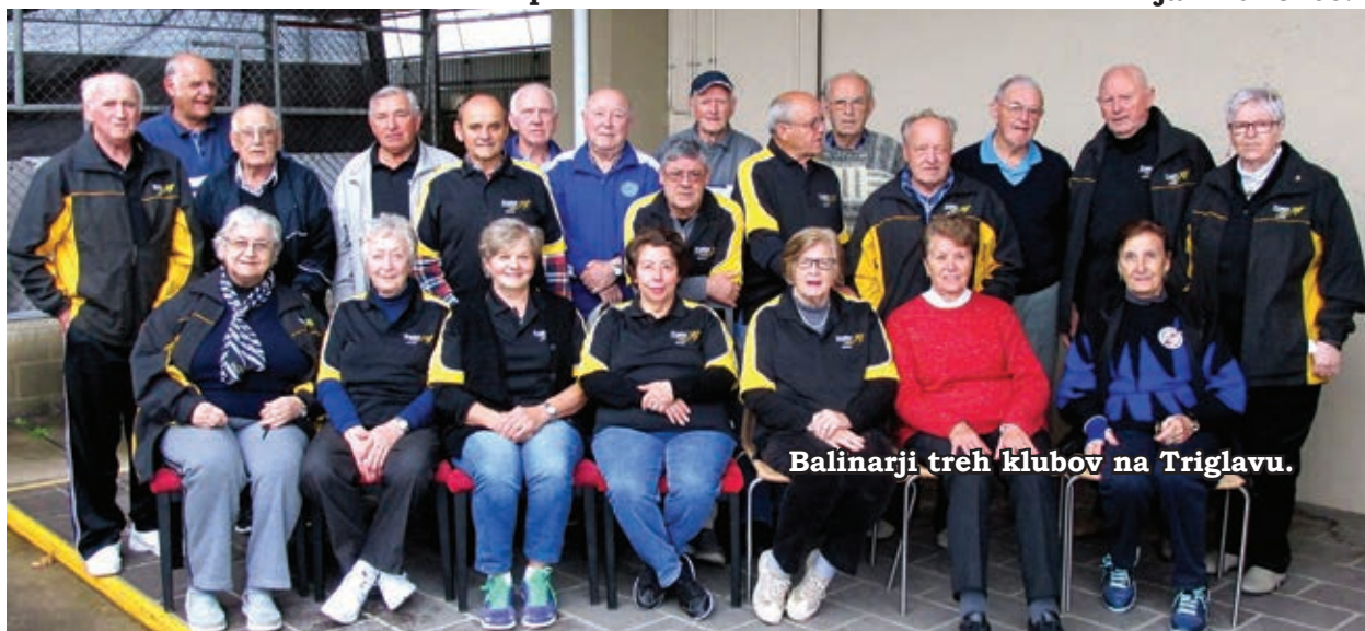
Balinarji treh klubov na Triglavu.