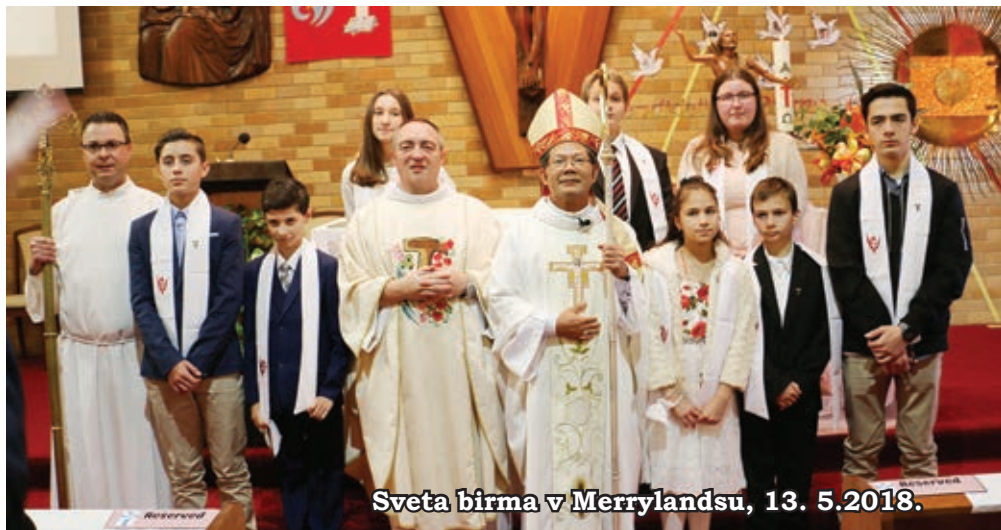
Sveta birma v Merrylandsu, 13. 5. 2018.