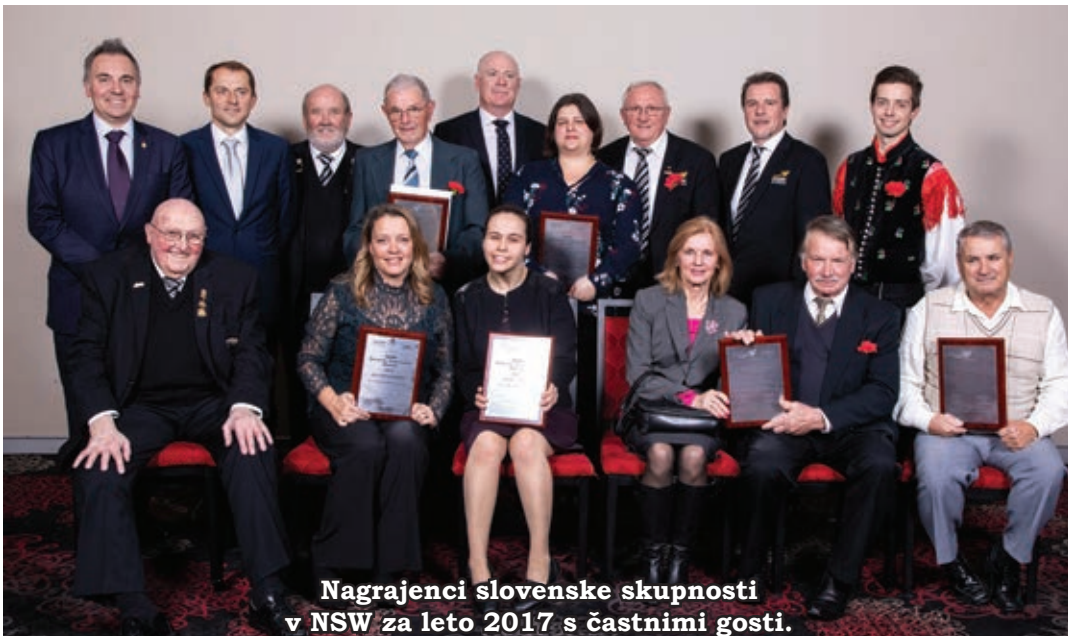
Nagrajenci slovenske skupnosti v NSW za leto 2017 s častnimi gosti.