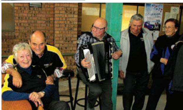
Veselko s harmoniko in veseli pevci.