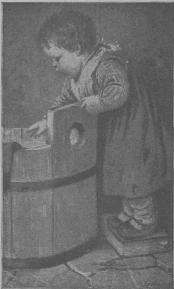
Kadar_Zorka pere . . .