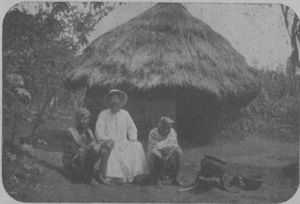
Misijonar roma od kočē do kočē in poučuje poganē v sv. veri.