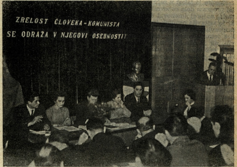
ZRELOST ČLOVEKA - KOMUNISTA SE ODRAZA V NJEGOVI OSEBNOSTI!

ka poglobljali in upoštevali spoznanj o njem. Človeka pa zaradi naše nevednosti mnogokrat postavljamo na neprimerno delovno mesto, ne znamo ga vključiti v skupino, ne znamo mu odmeriti zmogljivosti, ne znamo ga za delo motivirati in radi pozabljamo, da ni samo proizvodni delavec, ampak v prvi vrsti človek, član kolektiva, samoupravljaec. V našem podjetju imamo službe, ki so dolžne razmišljati in skrbeti za človeka, ga izobraževati in mu ustvariti take pogoje dela in takšno vzdušje, da bo postalo podjetje naš drugi dom in tukaj lahko ZK odigra pomembno vlogo.