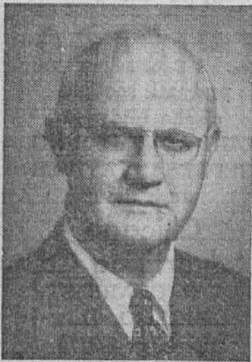
za ponovno izvolitev za državnega pravdnika

Državni pravdnik Herbert S. Duffy zopet kandidiral za ponovno izvolitev v ta urad, katerega je z odliko izvrševal. V ta urad je bil prvotno izvoljen leta 1937 za dve leti. V tem času je z uspehom zaključil zadevo z telefonsko družbo, potom katere so naročniki telefona dobili povrnjenih nad $7,500,000. Drugič je bil izvoljen v ta urad leta 1948 in se termin sedaj zaključuje.