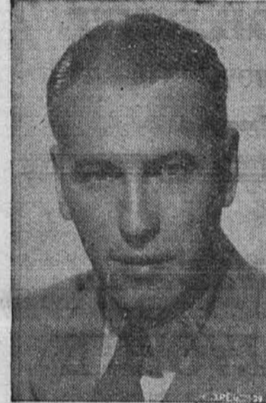
ROY C. SCOTT COMMON PLEAS COURT

rovalnini za veterane prve svetovne vojne, njih žena in otroke ter osebe, ki so bile odvisne od naših fantov-vojakov in mornarjev.