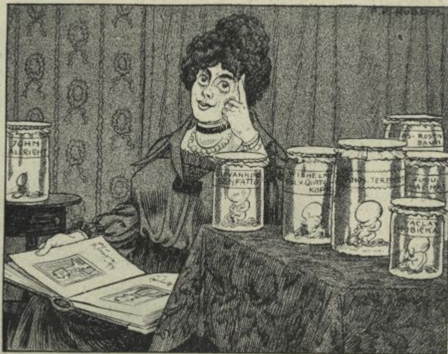
Njeni uspehi za časa svetovne vojne.