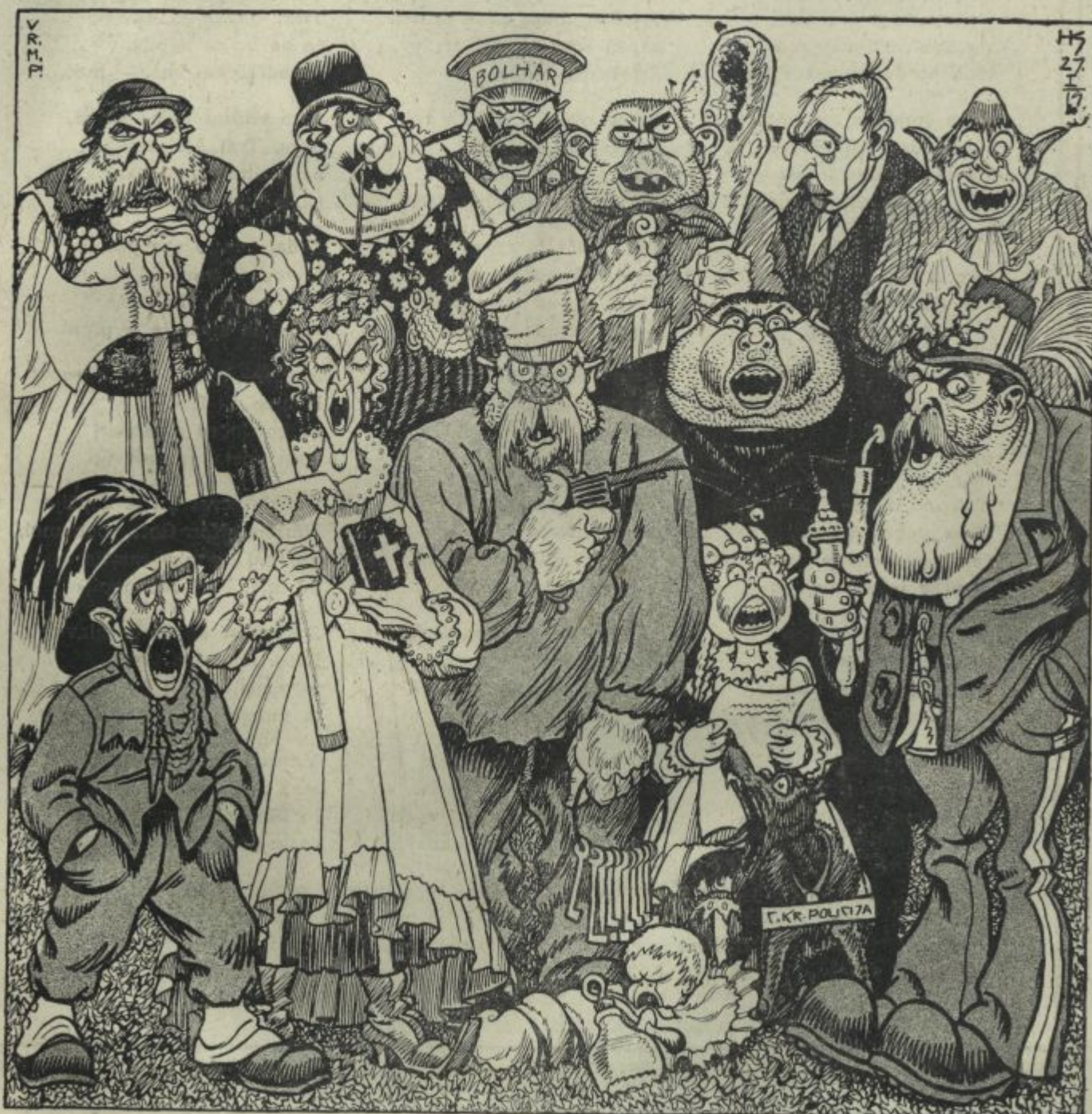
Jugoslovanski bolševiki in drugi.