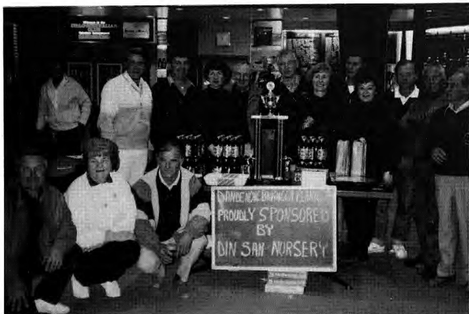
Prijateljsko - balinarsko tekmovanje me Italo-Aust. club & Planico 11.8.90