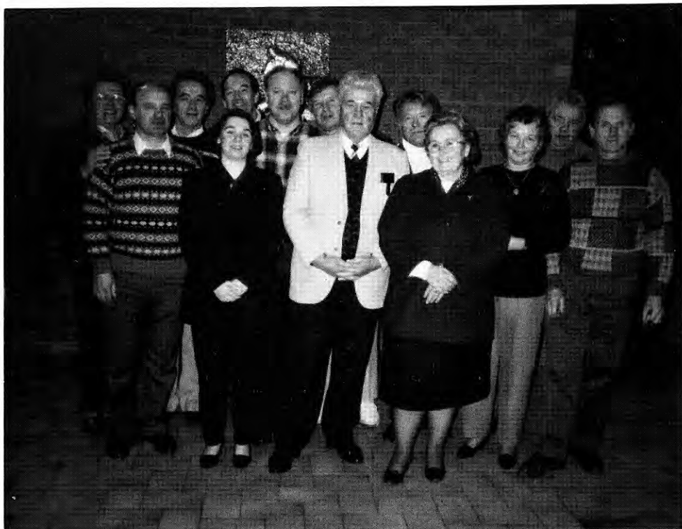
Odbor S.D. Planica za leto 96/97. Odsotna I. Mohorovičič.