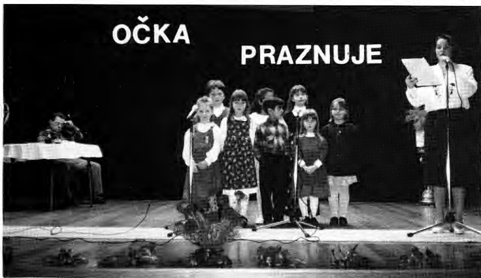
Učenci slov. šole pozdravljajo očete.