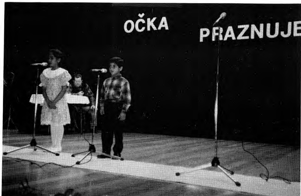
S slovensko pesmijo in veselo glasbo smo zaključili dan očetov na Planici.