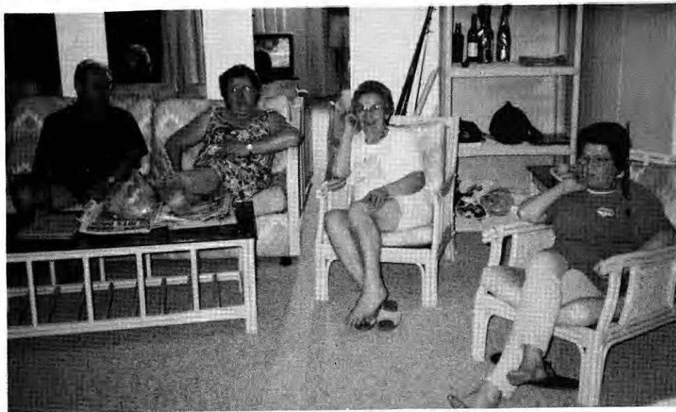
Veselo praznovanje na dopustu naših pridnih članov.