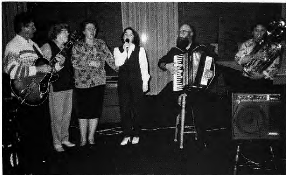
Domači muzikantje s pevci.