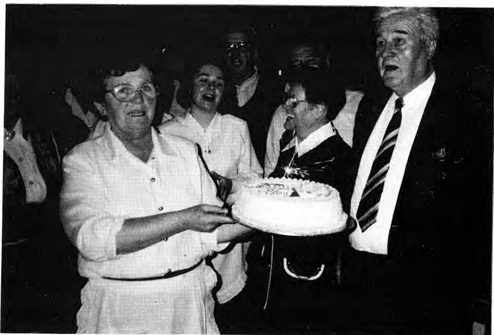
Našemu predsedniku še na mnoga leta!