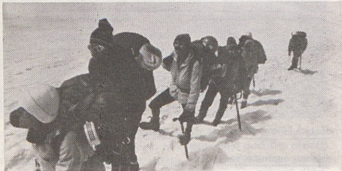
Delavci Gorenja so letos opravili enega izmed najtežjih izletov

Ljubitelje planin je na vsej poti spremljalo slabo vreme, doživeli so tudi nezgodo, kljub temu pa so se z novimi izkušnjami vrnili s te zahtevne poti. (hj)