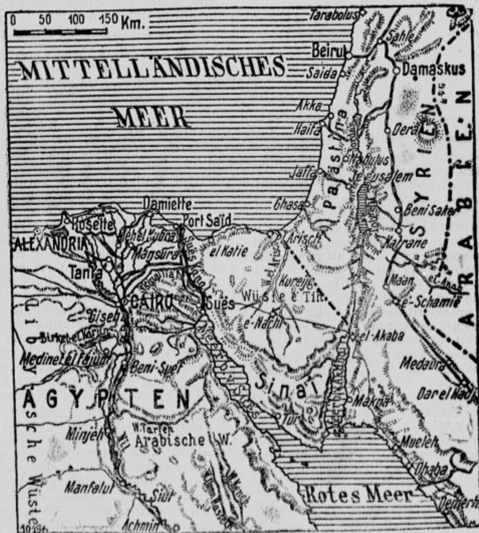
Zemljevid k prodiranju Turkov v Egipt.

Od Obrenovca do Beograda je 30 km, do železniške proge Belgrad-Niš pa samo 22 km. Belgrad je tedaj v nevarnosti, da bo kmalu popolnoma odrezan od ostale Srbije.