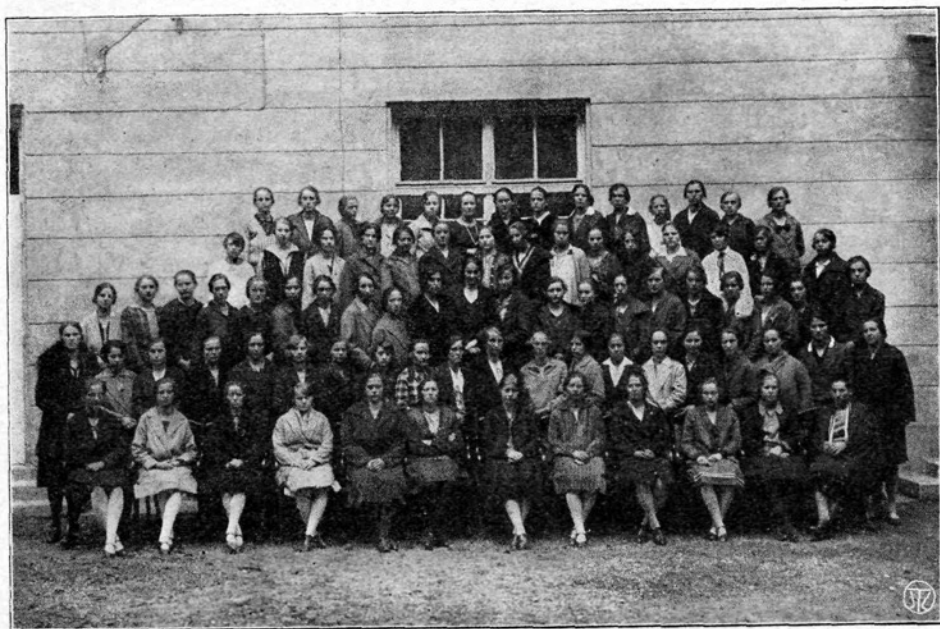
Udeleženke telovadnega tečaja Slovenske Orliške Zveze od 8.—13. oktobra 1928.

Telovadkinje imamo tudi drugo nujno nalogo: proučavanje in vežbanje čeških prostih vaj (ki so letos obvezne tudi pri nas). Natančno gib za gibom, vajo za vajo moramo navežbati, ako hočemo izvajati celotno sestavo brezhibno. Češke Orlice izvajajo vaje že vzorno, ali naj me zaostanemo za njimi?