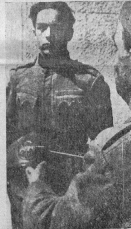
Nemški vojak jemlje našemu vojaku s šlema grb. Vojak stoji žalostno, a samozavestno

V zadnjih dneh so na Bolgarskem skočili iz tračnic štirje vlaki, deloma natovorjeni z nemškim vojnim materijalom. Dejanje pripisujejo komunistom, ki jih je bilo na Bolgarskem posebno v zadnjih letih mnogo. Stvar je zelo nerodna za nemško vojsko, ker zastaja promet, na katerega je navezana. Oblasti so brž ojačile straže vzdolž vseh bol-