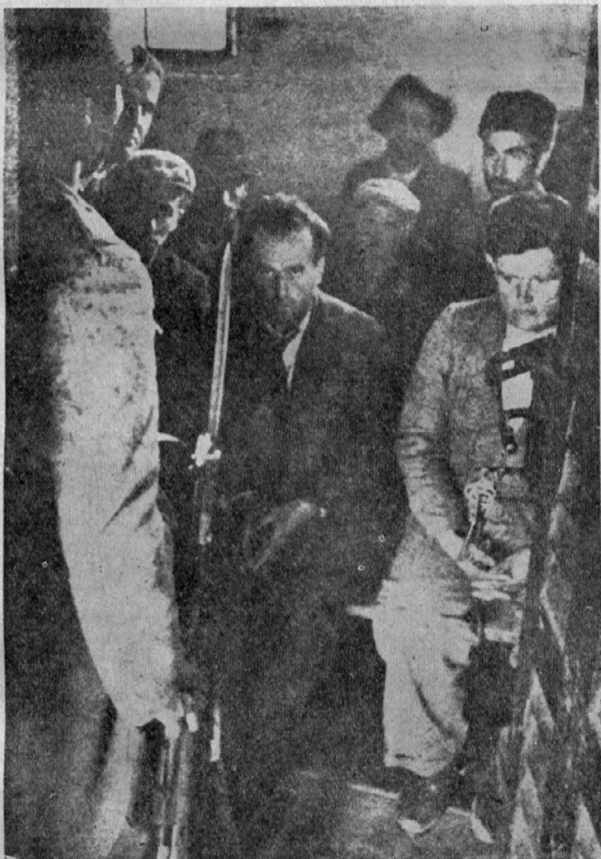
Hrvaški narod pod izdajalcem in utijalcem Paveličem ni zadovoljen. Slika nam predstavlja skupino teh nezadovoljnih ljudi, iz Hrvatskega Zagorja, zaprtih v sobi, ki jih straži Paveličev plačanec

Slovani se pa niso zavedali nevarnosti, marveč so naselili vsem spletkam nemške diplomacije. Ko je Hitler pripravljal napad na Češkoslovaško in so Rusi ponujali, da pošljejo Čehom pomoč, če udarijo tudi zapadne velesile proti Nemčiji, so si Poljaki pustili dopovedati od Hitlerjevih diplomatov, da ne smejo dovoliti prehoda rdeči vojski, ker bi to pomenilo konec poljske neodvisnosti; rdeča vojska se nikoli več ne bo umaknila iz vaše dežele, če ji odprete vrata — tako so dopovedovali Nemci in tako so jim Poljaki verjeli. Ko je Hitler sklenil napasti Poljsko in so si Angleži in Francozi prizadevali pridobiti Rusijo za skupen nastop proti nacizmu, kate-rega nevarnost so končno spoznali tako v Londonu kakor v Parizu, so nemški diplomati prepričali Ruse, pa tudi mnoge druge, da Anglija samo spletkari z namenom, da bi sprožila boj med Nemčijo in Rusijo ter potem lepo gledala, kako se koljeta dva naroda, ki jih ona, Anglija, oba (sovraži. Nemška propaganda je bila tako spretna, da je prav mnoge prepričala in jim tako zmedla pojme, da še sedaj ne vidijo jasno, čeprav so na lastne oči videli, da je Anglija šla v vojsko, čeprav Rusija tedaj ni šla; da z nacizmom noče skleniti miru, čeprav ga Hitler ob vsaki priliki ponuja; da Anglija ni hotela nič slišati o neki križarski vojni proti boljševizmu.