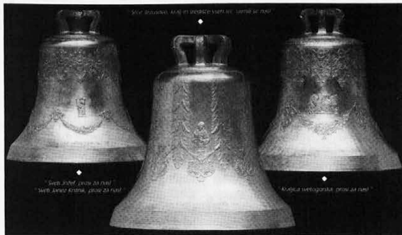
Spominska razglednica ob blagoslovitvi zvonov v Vrtojbi

V nedeljo, 17. t.m., je Vrtojba, velika vas na goriškem polju tik ob državni meji z Italijo, doživela redko slovesnost. Blagoslovljeni so bili namreč novi zvonovi, ki jih je vlila znana livarna Ing. Francesco de Poli iz Vittorio Veneto v pokrajini Treviso. Sicer pa Vrtojba do sedaj ni bila brez zvonov. Vlili so bili leta 1964 na Reki in intonirani na glasove E, Gis, H, a so zaradi pomanjkljivih izkušenj livarne bili premalo blagozvočni in tudi po velikosti nikakor niso ustrezali tako razprostranjenemu kraju.