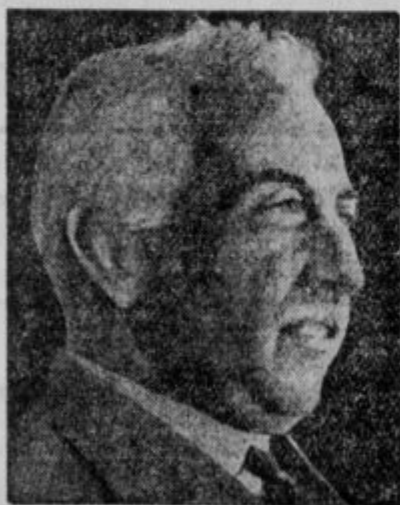
Zmagovalec pri španskih občinskih volitvah

Wolfram, zlato, diamanti, to vse je prav za prav pretveza. Ljudi, ki iščejo danes, ki so iskali pred sto leti, kakor pred tisoč leti, te žene strast, ki se ne da uničiti. Fanatično verujejo v svojo srečo. Desetletja dolgo. Kljub vsem ponesrečenim poskusom. Verujejo v svojo srečo, ko so že skoro znoreli od pomanjkanja kakor samotni samotar v Skidoru.