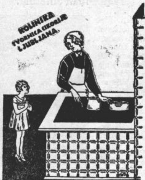
Prava Kolinska cikorija