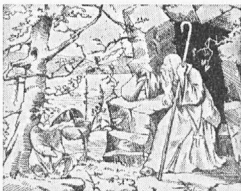
Pušcačnik išče palčka.

Misijonar je pridigal o nenadni smrti: »Že marsikdo je šel zvečer zdrav in čil spat, zjutraj pa je mrtev vstal.«