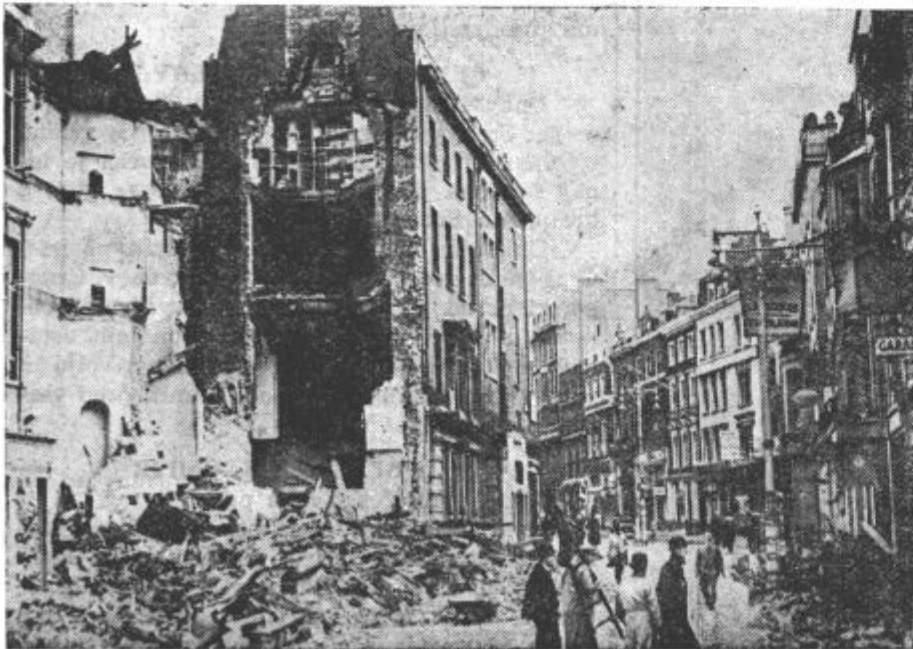
Takšne so hiše v Londonu, ki jih zadenejo nemške bombe

Glede poljske vojne mornarice je omenil Sikorski, da bodo Angleži nadomestili vse izgube, ki jih je pretrpela.