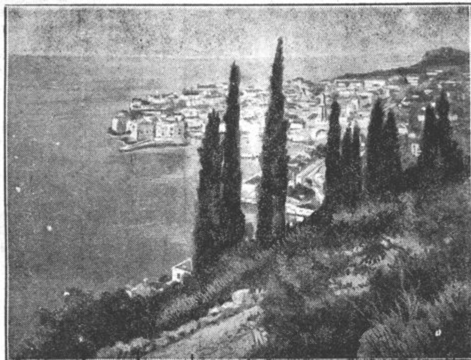
Pogled na naše morje

Javni nameščenelec nam piše: Pred nedavnim časom sem prišel na ljubljanski trg. Okoli jerbasa krompirja je stala gruča žen, ki so kričale na vse pretege. Kmetica je zahtevala za lep, izbran krompir 2 din. To se je seveda zdelo kupovalkam preveč in so se silno razburjale. Nisem se mogel zdržati