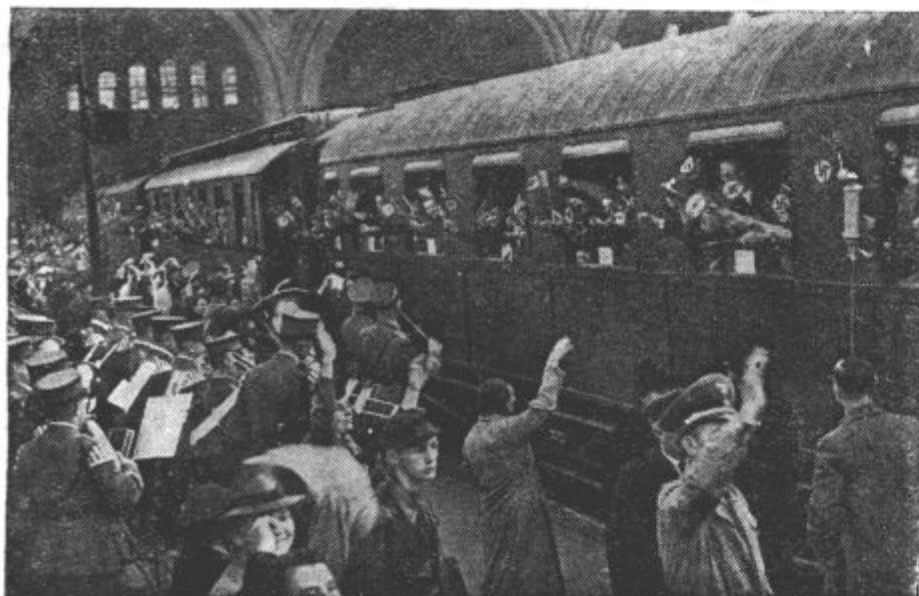
z velikih mest spravljajo otroke na varno. Tudi iz Berlina odhaja mladi rod na deželo

Po dveh dneh presledka so nemški bombniki ponovili napad na Birmingham in zopet obsuli z najtežjimi bombami razne industrijske naprave in skladišča.