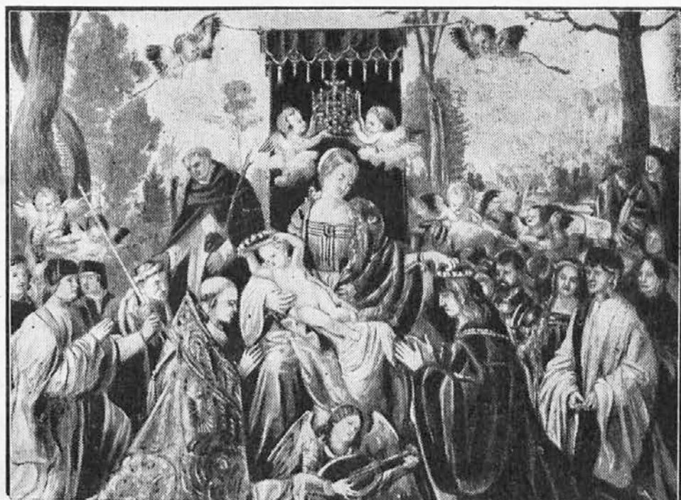
Dürer: Kraljica presvetega rožnega venca