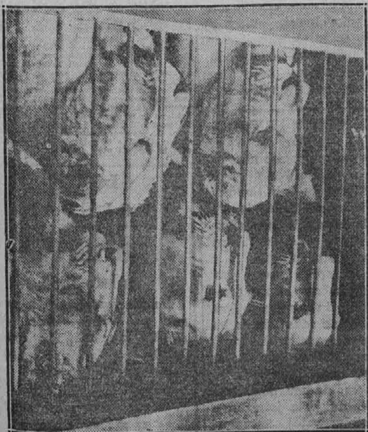
Skupina mladih levov, ki so namenjeni za Hollywood, da postanejo filmski "igranci".