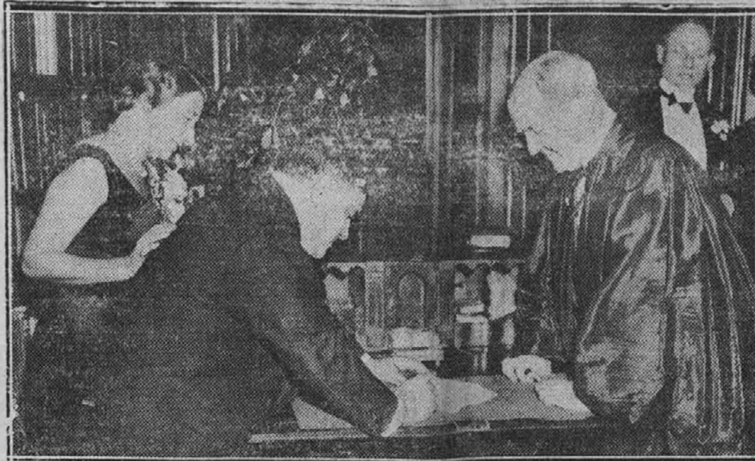
Slika kaže novega župana mesta New York, ko je ob svojem nastopu 1. januarja, podpisoval prisego vpricho nekoga sodnika, člana vrhovnega sodišča države New York. Navzoča je tudi županova soproga.