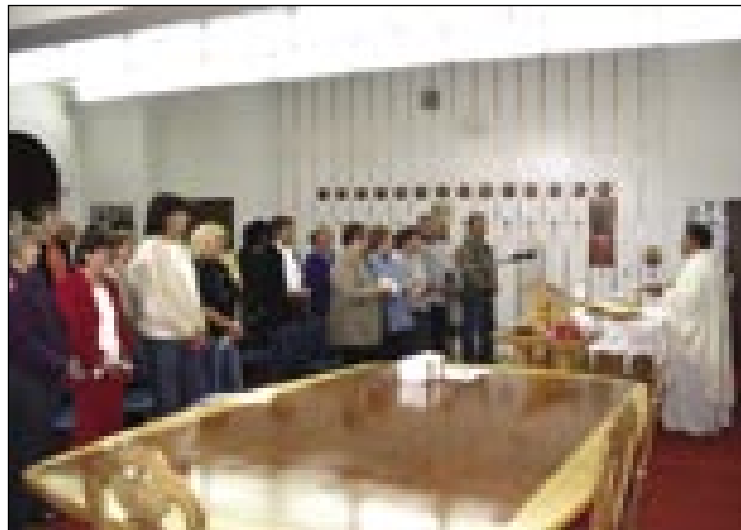
Sveto mešo smo meli v dvorani frančiškanov

Bohinja med viskimi bregami. Pri cesti v dolej je pa tekla Sava (Bohinjka), tak čista kak sveklost. Kakši 25 kilometrov smo se pelali do Bohinjskega