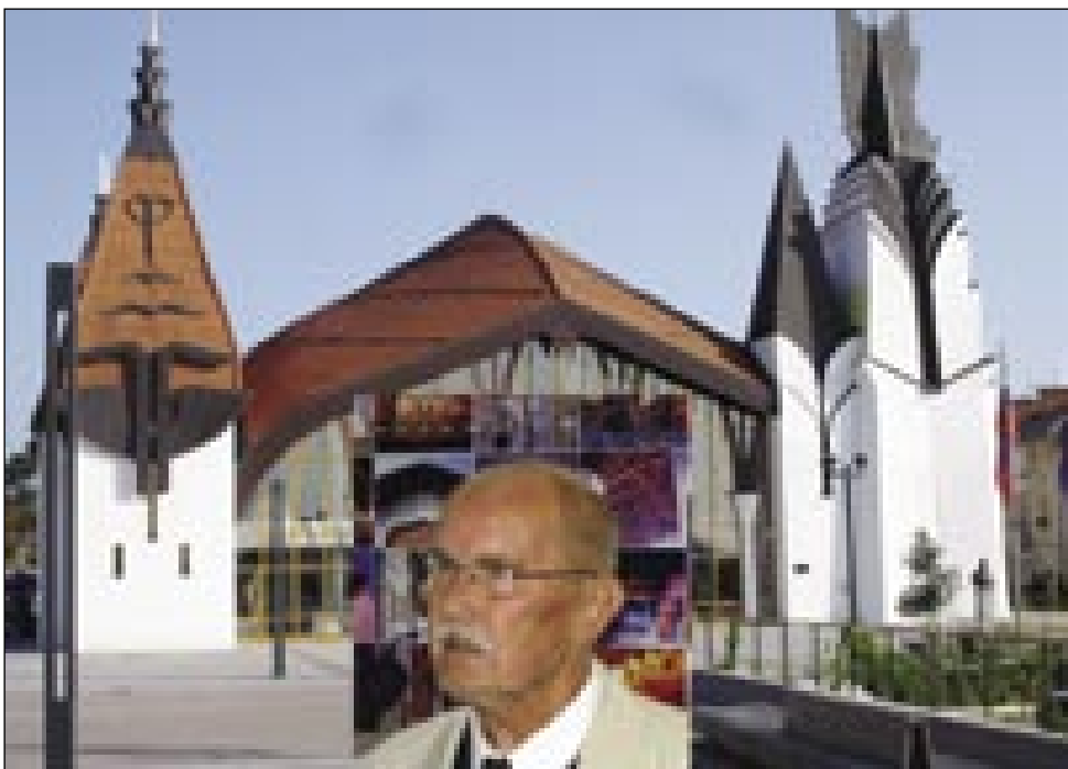
Lendavski kulturni dom in arhitekt Imre Makovecz

Čeprav za načrte in arhitekturna snovanja Imreja Makovcza zatrjujejo, da gre za funkcionalne objekte, v celoti ocene