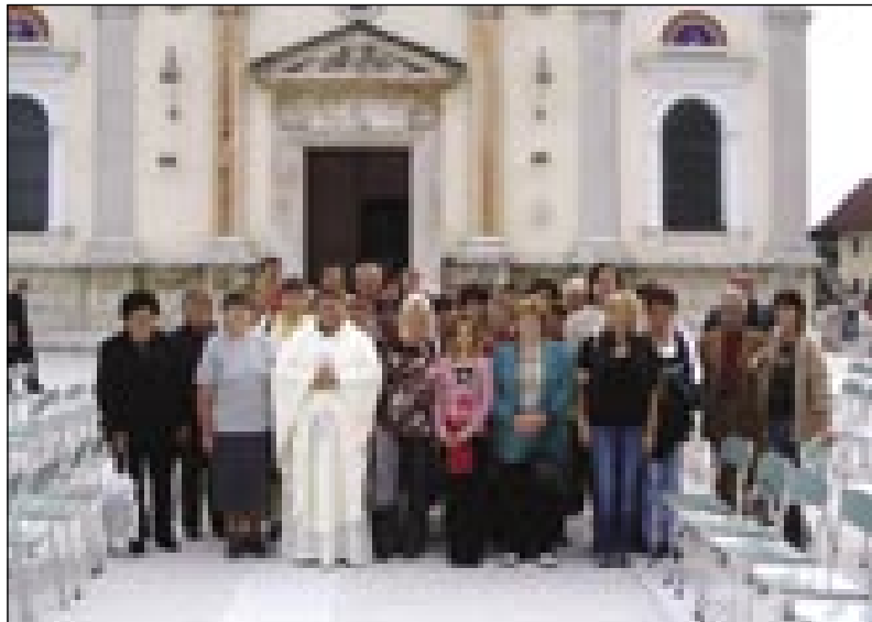
Sakalauvski prauškarge pred baziliko na Brezjah

Dühovnik je zakon blagoslovo pa njima je želö, naj duga lej-ta ešče vtjüp doživeta z Boga pomočjav. Gda smo mi z mešov končali, je pred Marijin kejp tö prišo eden mladi par k zdavanji. Smo je poglednili, potistim smo pa na obed šli. Düšo smo si nahrani-li s hostijov, te smo pa tejlo tö mogli nahrani-ti. Pri obedi smo malo cajt tapo-tegnili, ka je že prejk pau tretje vöre bilau, gda smo se vtjüppo-brali pa smo se pelali na Bled. Tam smo se nej stavili, liki smo se pelali dale do