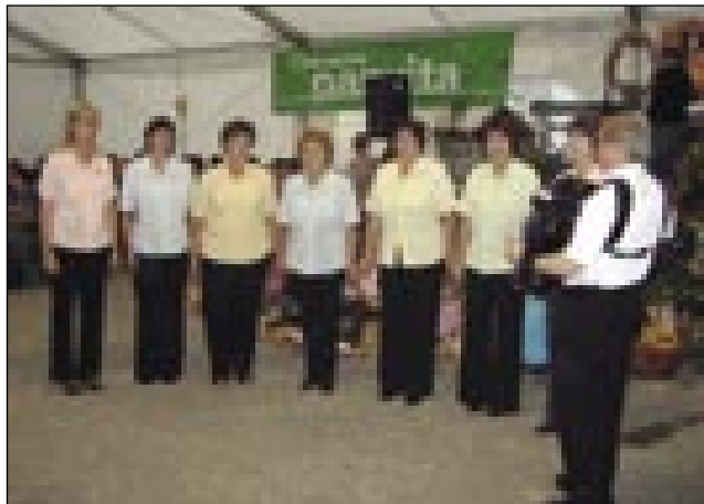
Sombotelške pesmarce med spejvanjom

pogučavali pa nej poslüšali. Med programom pa so se na odri hejcali vert, šteri je kukarco dau, pa mlajši. Njine pikantne pripovejsti je lüstvo rado poslüšalo. Tačas, ka so skupine spejvale, pa so že najmlajši najšli kukarco za lüpati. V tistom cajti, gda je program biu, so skor vse vöölüпали. Prva, kak bi se začnila veselica z ansamblom Plamen , so