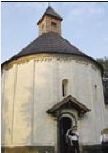
Stara okraugla kapejljica v Seli

njej živejo tak katoličange kak evangeličange. En par vogrski držin tö geste, vej je pa grajnca nej tak daleč, pa mlajši tö v sausednje Prosenjakovce odijo v šaulo. Selo je erično po svojoj maloj cerkvi ali kapejli, štero so zozidali v 13. stoletji. Ništérni čednjaki pravijo, ka je najstarejša takša zidina v Sloveniji. Zove se »rotunda«,