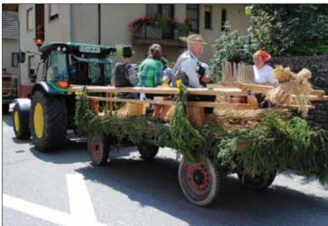
Rdeča nit letošnje povorke je bilo žito.