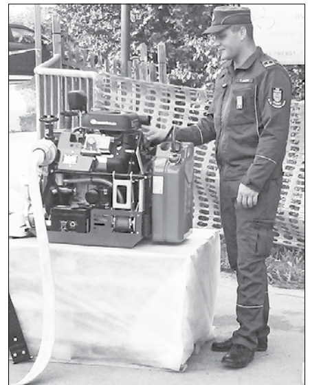
Nova črpalka mozirskim gasilcem omogoča hitro in učinkovito posredovanje.

Zaradi kar tridesetih enot, ki so se letos ude-