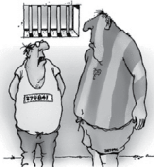
Dokler bom v zaporu, se ne nameravam sončiti.

Prosim, da zaprete vedeževalko, ki me je posredno nagovorila k ropu, saj je obljubila, da me čaka svetla prihodnost, ni pa pojasnila, da bodo to policijske luči pred banko.