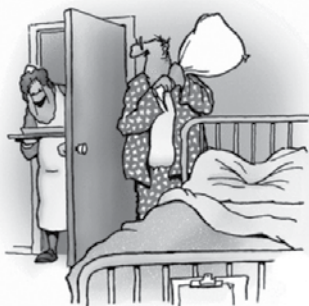
Kdo čaka na injekcijo?

Predlagam, da zapornikov ne spuščate več ven na delo. Sploh med vikendi, saj jih takrat večina vlamlja v vikende.