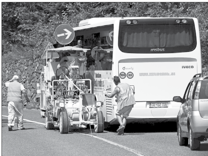
Bližnje srečanje stroja za obeleževanje cest in avtobusa v Primožu pri Ljubnem.