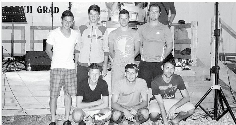
Najboljša ekipa turnirja v malem nogometu v Gornjem Gradu so bile Veveričke.