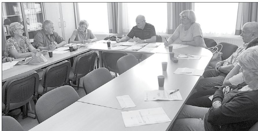
Izvršilni odbor območne organizacije stranke DeSUS je izrazil zadovoljstvo nad doseženim rezultatom na državnozbornskih volitvah.