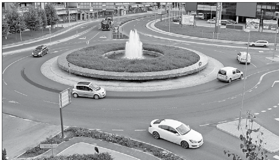
V Velenju so zagotovljeni optimalni pogoji za opravljanje voznških izpitov, kljub temu pa je tamkajšnji izpitni center tik pred ukinitvijo.