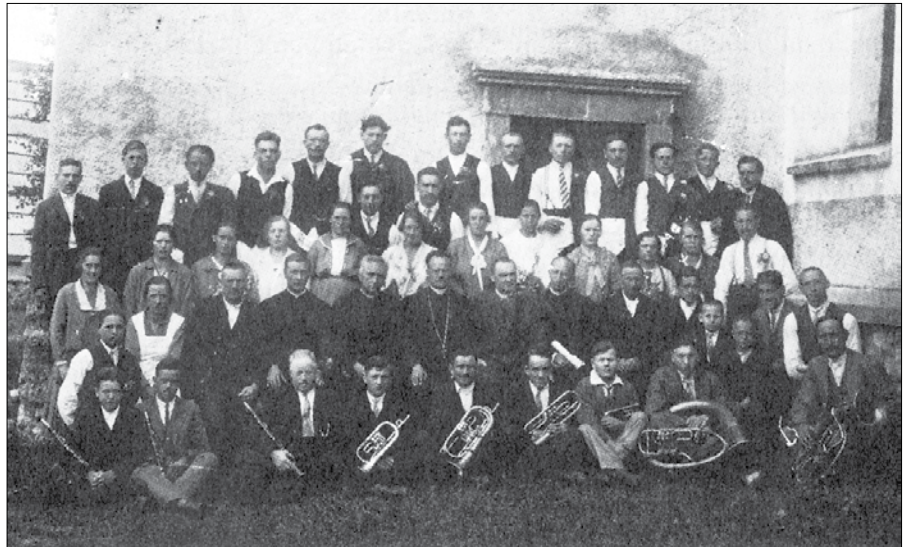
Šmihelska godba pri Sv. Krizu nad Belimi vodami kmalu po prvi svetovni vojni, ko so »vlekli« v zvonik nove zvonove.

mu je le ena všeč, ker je ponižnega in čednega duha, kot ponižna vijolica, to želimo od vas, hišni oče, gospodar in oče starešina. Da bi vam bila blaga volja njo nam izročiti in sicer v znamenju sreče in blage volje z glažkom vina in rožmarinom v roki.