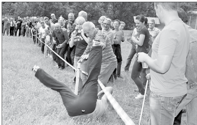
Tek po sukanju okrog kola je bil za nekatere tekmovalce misija nemogoče.