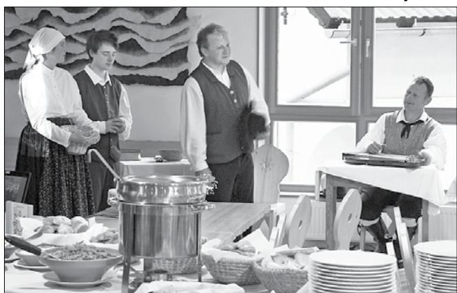
Igralci Kulturnega društva Franc Herle so predstavili dogodek iz preteklosti Solčavskega.