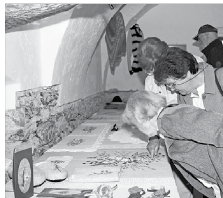
Obiskovalke so občudovale pletenine, vezenine, kvačkane prte in izdelke iz različnih materialov.