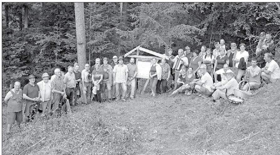
Udeleženci dogodka na Mlakerjevi domačiji pri informacijski tabli, ki označuje zelo redko drevesno vrsto.