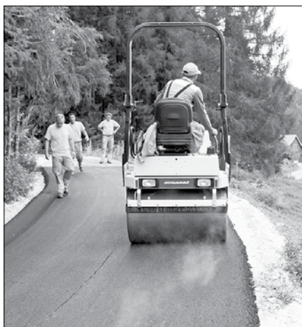
Asfaltno prevleko ima zdaj tudi cesta od Goloba do Cahovnika v Konjskem Vrhu.