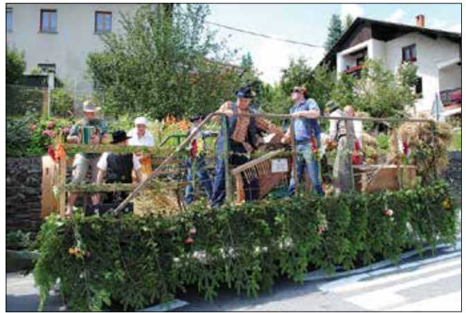
Stara ročna mlatilnica iz časov, ko so kmetje še doma sejali žito.

Vrhunec vsakoletnega dogajanja na Flosarskem balu je udiranje flosa in flosarski krst. Letos so poleg večjega udrii še manjši flos, ki sta ga pod nadzorom izkušene flosarja krmarila dva mlade-