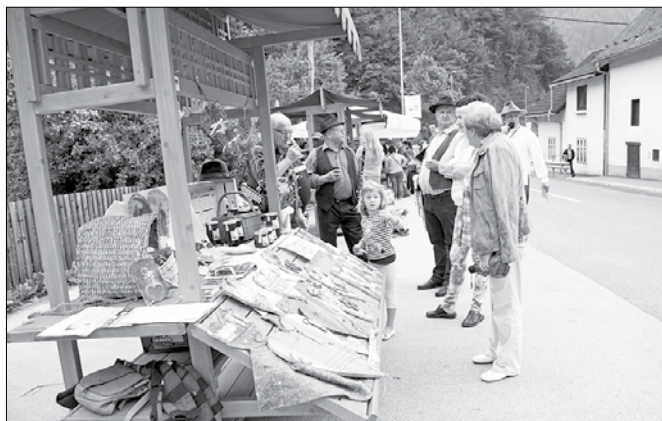
Na ogled in za nakup je bil pester izbor različnih izdelkov za dom in vsakdanjo rabo.