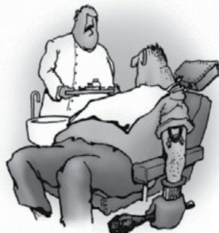
Ne skrbite. Verjetno bo mene bolj bolelo kot vas.

Prosim, da nam za državne praznike pripravite res boljšo hrano. Pri tem tudi jaz želim pivo. Prosim, da to vzamete na znanje čim prej, saj bo kmalu Marijino vnebovzetje.