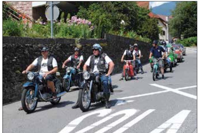
Tudi starodobniki so redni udeleženci povorke na Flosarskem balu.