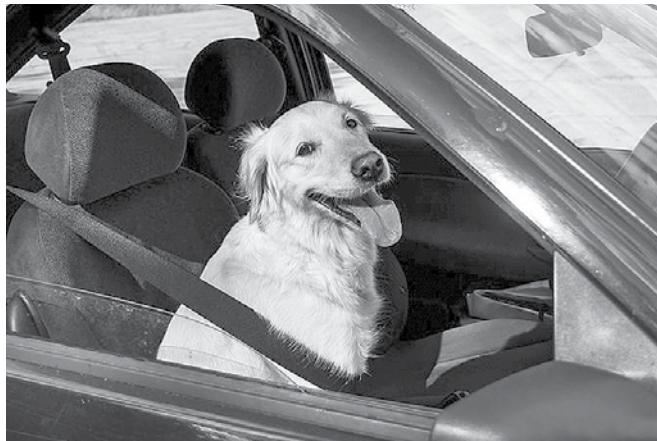
Vožnja živali na sedežih nima nič skupnega z varnostjo, zato ni dovoljena.

Pri AMZS ugotavljajo, da se navade slovenskih voznikov in voznikov spreminjajo, k sreči tudi v po-