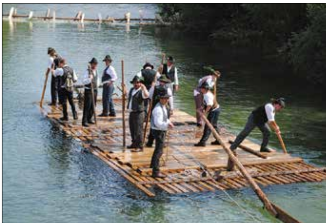
Flosarji so za gledalce opravili krajšo rajžo.