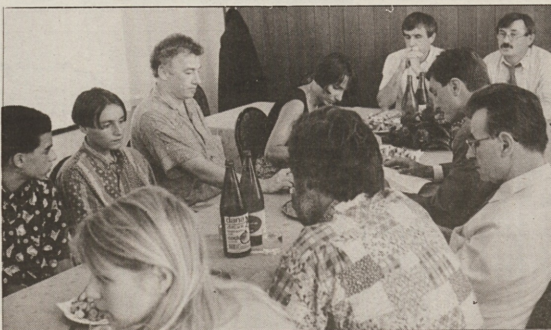
Slika: Sašo Bernardi