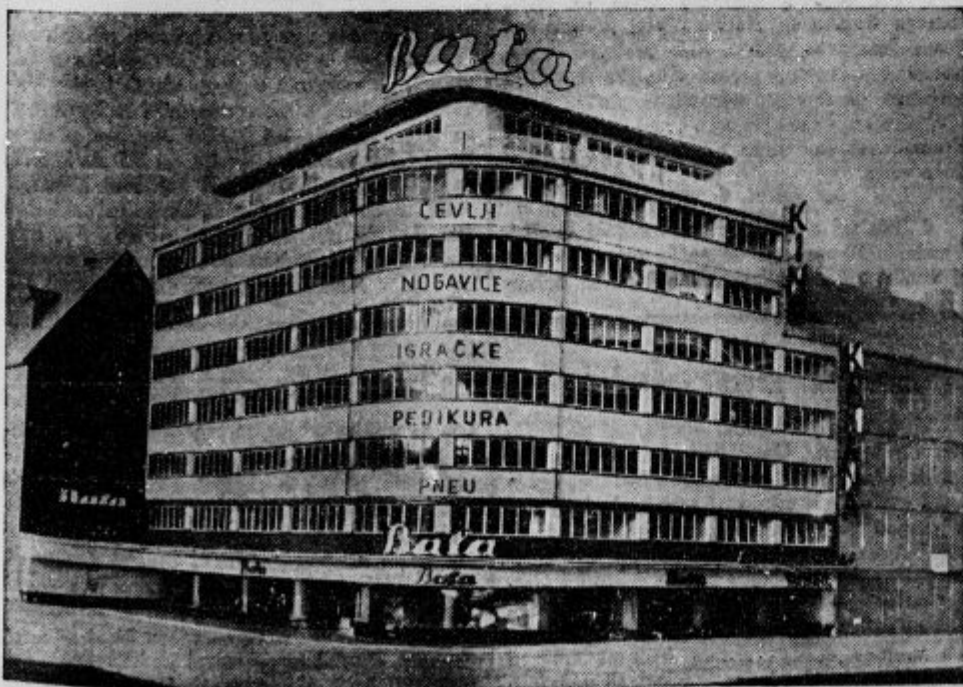
Tvrčka Bata začne te dni zidati v Ljubljani pred pošto veliko palačo. Kakšna bo, vidimo na sliki