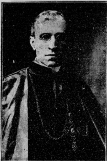
V Budimpešti je te dni svetovni evharistični kongres. Sv. oče je poslal na kongres svojega posebnega legata kardinala Pacellija, ki so ga v Budimpešti slovesno sprejeli

Sokola kraljevine Jugoslavije, ki je bil v Belgradu, je bila objavljena tudi statistika, po kateri je v to zvezo včlanjenih 126.567 članov in članic in 110.316 naraščajnikov. Statistika pravi, da je v tem številu največ kmetov, in sicer 25,2%, na drugem mestu pa so državni nameščenci, in sicer 13,6%. Zanimivo bi bilo ugotoviti, koliko pravega narodnega in državo tvornega duha vsebujejo povedane številke.