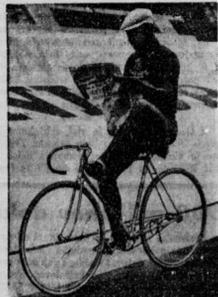
Ta pa znal! Po naših cestah bi kolesar na tak način ne prišel daleč, po modernih asfaltiranih pa je tudi taka vožnja mogoča

d V lase so si skočili. — S spori, ki so nastali med HSS in SDS v Splitu, se peča