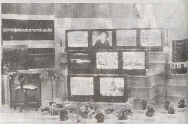
V hotelu Vesna je Gorenje Servis predstavilo svoje dosežke s področja kablensko distribucijskih sistemov RTV programov

Podatke o odstotku doseganja mesečnih planov proizvodnje v pogojnih enotah so nam posredovale službe za plan in analize