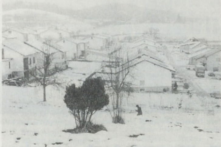
Zimska idila novega dela Mirne