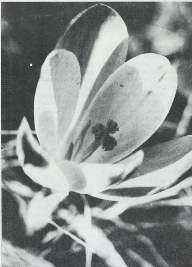
Samo še nekaj dni nas loči od pričetka pomladi

krompirja dokaj normalno. Predelali smo nekaj preko 11.300 ton svežega krompirja, iz katerega smo dobili 1.517 ton izdelka, krompirjevih kosmičev. To pomeni, da smo porabili 7,45 kg svežega krompirja za 1 kg kosmičev, kar je nekaj nad našim normativom, ki je postavljen na osnovi dobrih prvih let predelave na 6,8. Za tako prekoračenje tega normativa sta dva glavna vzroka: