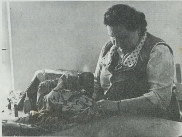
Žena se danes enakovredno vključuje v gospodarske in družbene tokove

Pri delovanju krajevne organizacije SZDL in drugih družbenopolitičnih organizacij smo opazili, da se v pretežni večini primerov srečujemo na raznih