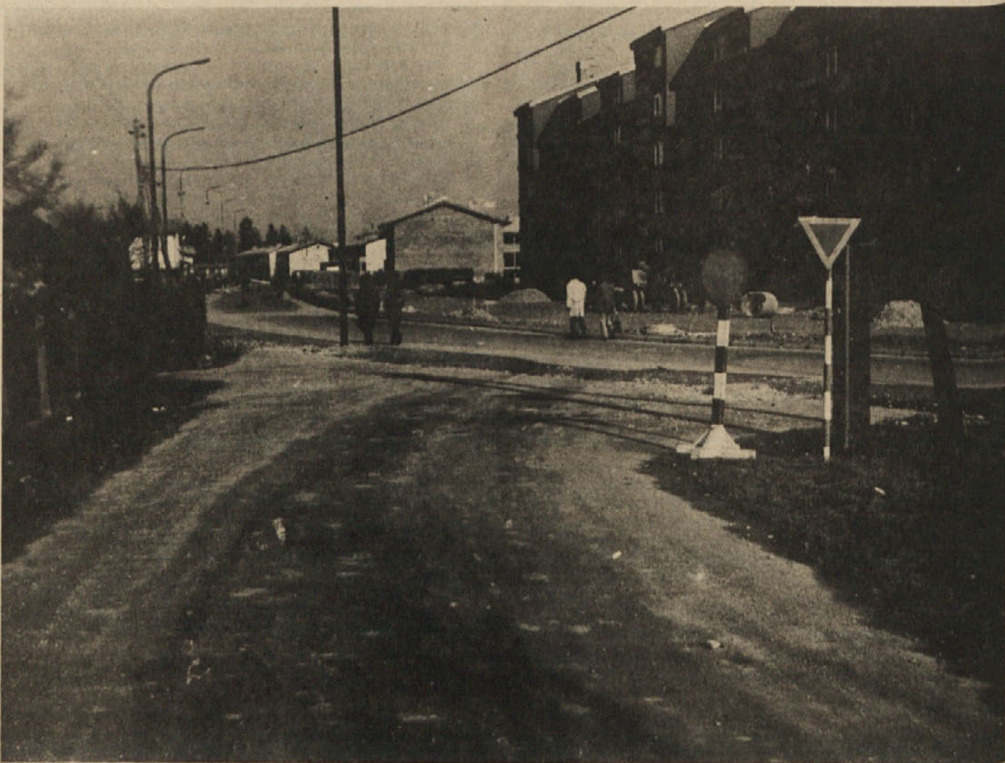
Zalog se hitro gradi, kar pa povzroča tudi probleme. Ne le podvoz, tudi Agrokombinatska cesta ni povsem po godu občanom

Zelo pomembna naloga javnega pravobranilstva je dajanje pravnih mnenj in druge pravne pomoči državnim organom na njihovo zahtevo v zvezi s sklepanjem premoženjsko pravnih pogodb in z drugimi premoženjsko pravnimi vprašanji. Poleg tega pa javno pravobranilstvo zastopa družbenopolitične skupnosti, njene sklade, ki so pravne osebe, krajevne skupnosti ter državne organe, ki so pravne osebe in zavode posebnega družbenega pomena, ki dobivajo povračilo iz proračuna družbenopolitične skupnosti ali iz družbenega sklada, ki je pravna oseba, v njihovih premoženjskih pravicah in obveznostih pred sodišči in drugimi državnimi organi. Navedenim subjektom je javno pravobranilstvo zakoniti (procesni) zastopnik.