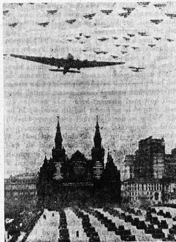
Parada sovjetskih letal v Moskvi

Se slabše so razmere na kmetih. Boljševiki so si pridobili mučike z razdelitvijo veleposestev med male kmete. S tem pa so prelomili osnovno načelo marksizma, ki prepoveduje zasebno lastnino. Jasno je, da so zato sovjetski mogotci, brž ko so se čutili dovolj varne, kmalu sklenili, da odpravijo stanje, ki ni bilo v skladu z Marksom.