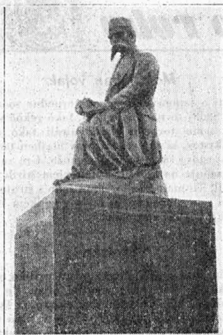
Spomenik Vuku Karadžiću, ki so ga pred kratkim postavili v Beogradu

nim odkritjem in njegovim rezultatom, ne moremo pa nikoli prav razumeti in doumeti one neopazne životvornosti sile, iz katere raste duša naroda.