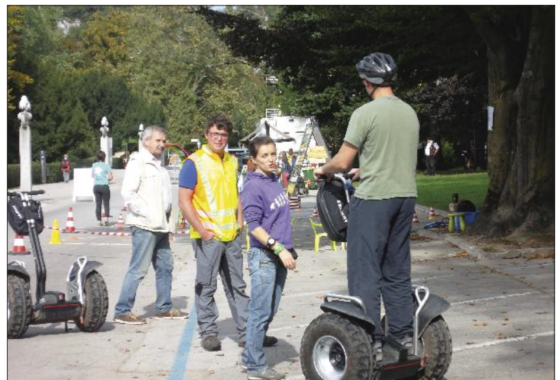
Električno vozilo Seagway.