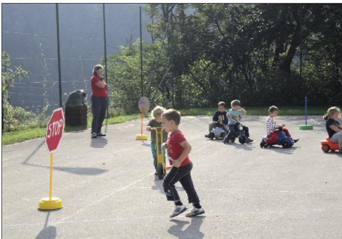
Otroci so se igrali in učili.