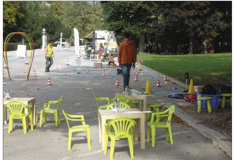
Otroci so nevarnosti v prometu spoznavali na poligonu Cesta ni igrišče.