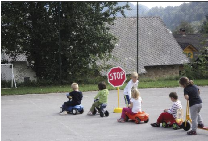
Teden mobilnosti v vrtcu na Bohinjski Beli.