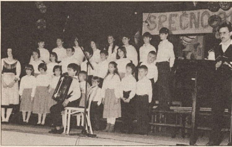
Mlajši mladinski zbor SPD „Danica“