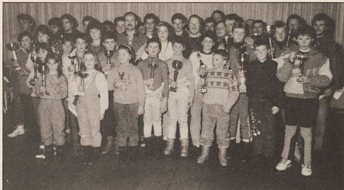
Nagrajenci Koroškega deželnega sankiškega prvenstva