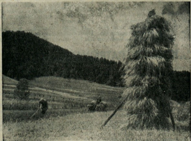
Kmetje so poželi žito in ga v glavnem tudi že omlatili. Ponekod sušijo žito v kozolcih drugod pa v ostrnicah na njivi