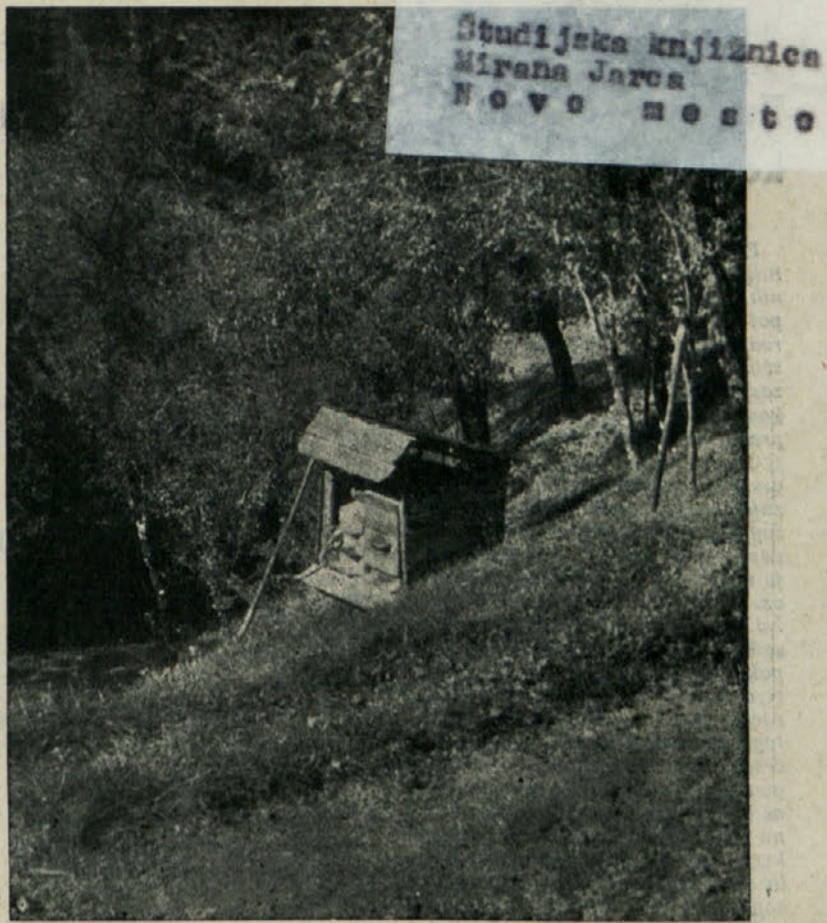
Cebeljak na pobočju Turjaka