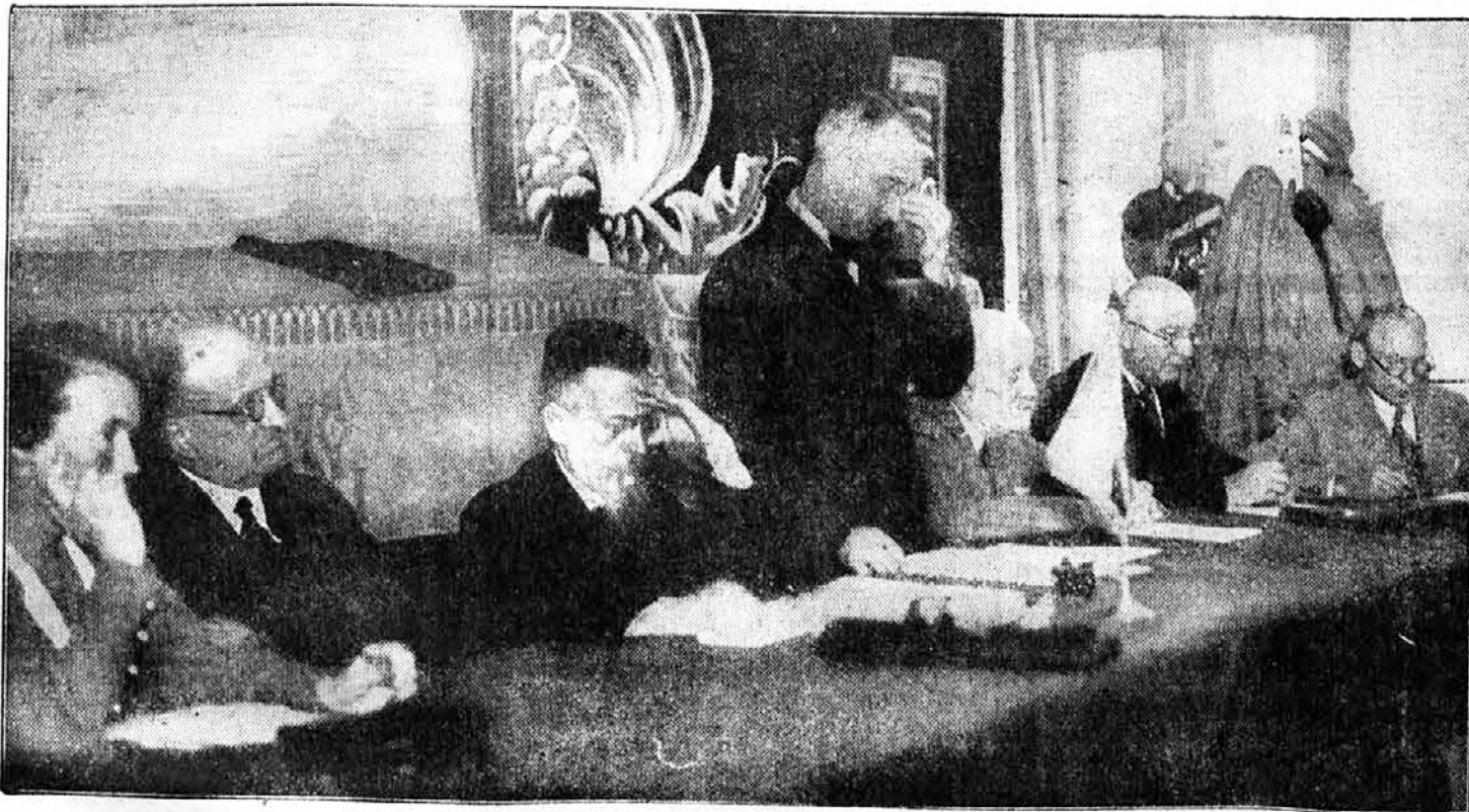
Sa sokolskog zborovanja u Beogradu: pretsedništvo zbora