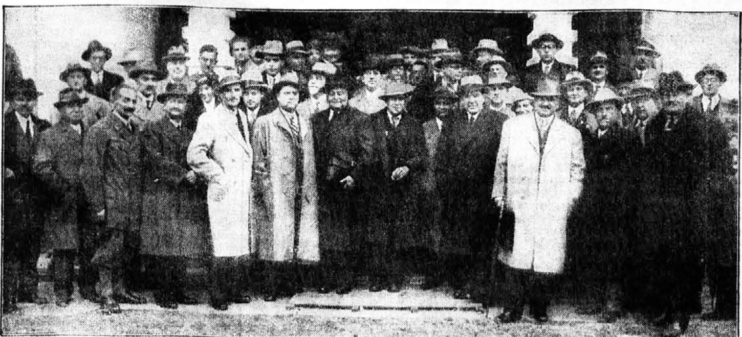
Deo učesnika zbora pred letnjim domom Sokolskog društva Beograd I