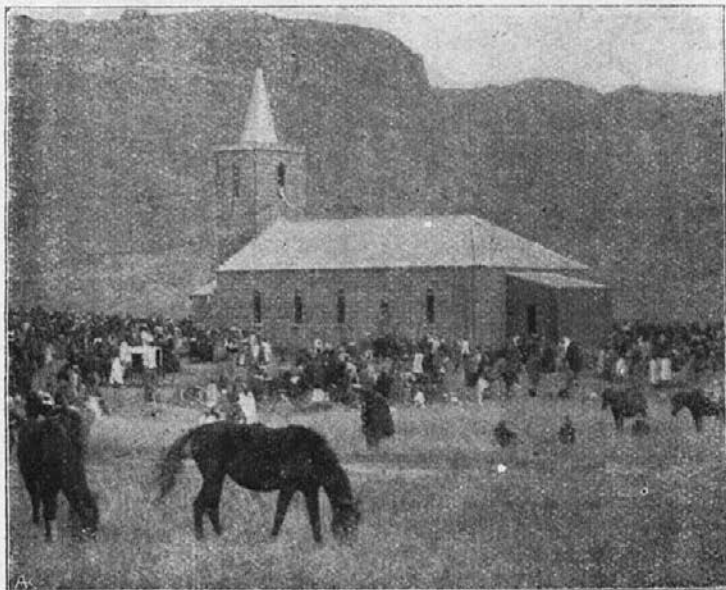
Od kralja Nathanaela Griffitha zidana cerkev je končana.

Klaverja 4. maja 1916 sledeče: »Ravnokar dovršeno potovanje je bilo precej težavno, ker sem iz varčnosti potoval večinoma peš in sam: 1200 kilometrov, torej polovico pota je peljalo skozi grmovje. Toda čeprav je bilo to apostolsko potovanje zame priletnega moža zelo naporno, vendar mi je prinašalo mnogo dušne tolažbe, ker mi je nudilo obilo priložnosti za izvrševanje dobrih del, kakor tudi