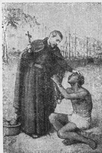
Sv. Peter Klaver, apostol zamoreev, prosi za nas!