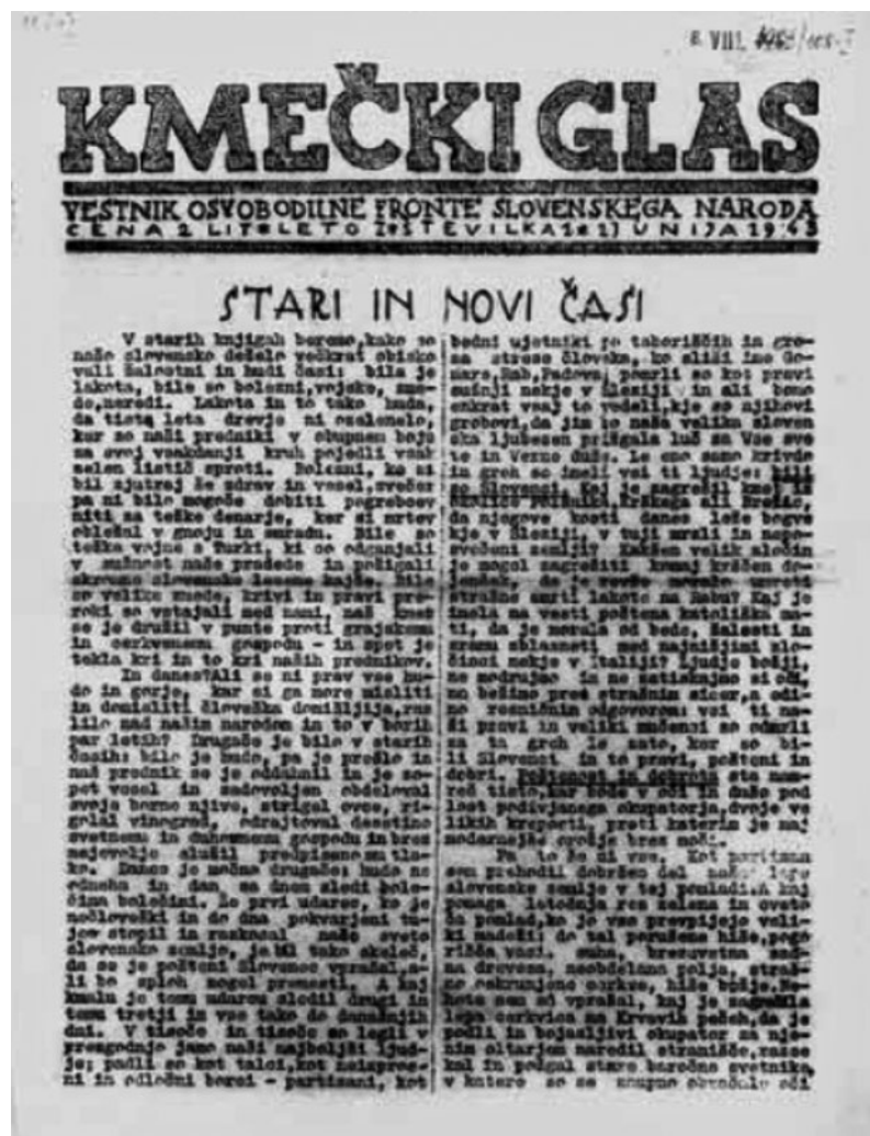
Prva naslovnica Kmečkega glasa iz leta 1943.

Učitelj s seboj v razred prinese nekaj izvodov časopisa, če ima možnost, tudi nekaj števil iz leta 1991. S tem pri učencih vzbudi zanimanje in jih pritegne k prebiranju časopisa. Prek pogovora ugotovijo, da so časopisi odlični zgodovinski viri in pričevalci o življenju v preteklosti, saj predstavljajo odsev življenja določenega časa. Učitelj se z dijaki pogovarja tudi o tem, od kod so avtorji prispevkov črpali podatke, sploh v preteklosti, ko še ni bilo interneta. Tu se dijaki zavedo tudi pomembnosti tiskane besede v preteklosti, ki je bila glavni in najbolj trajen prenosnik informacij.