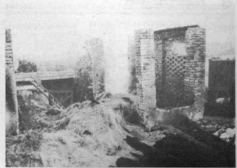
Pogorišče pri Rubinovih na Jastrebcu