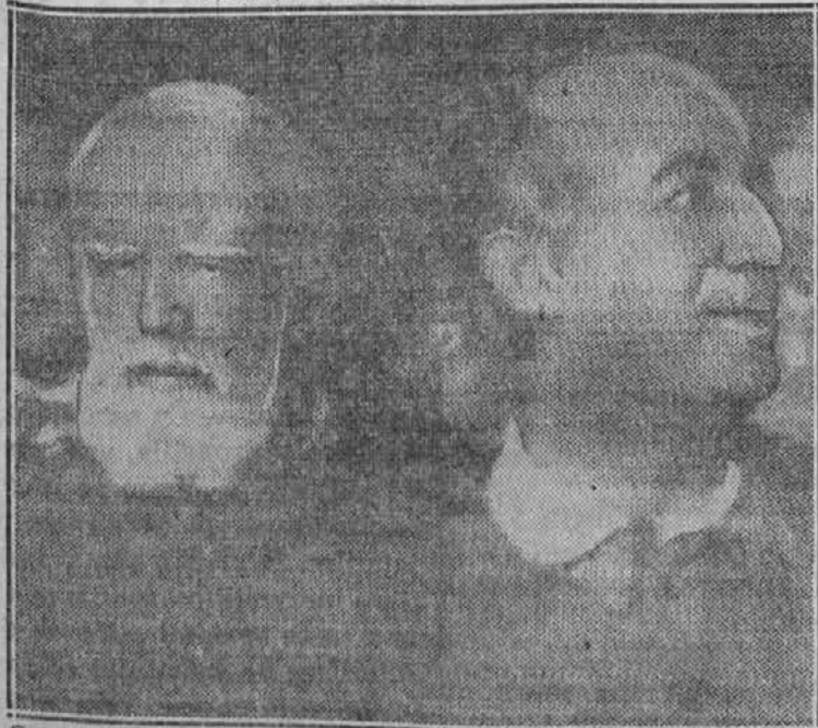
Gornja slika je bila poslana iz Evrope po radio in na desni na njej se vidi španski general Franco, ki je načelnik španske uporniške armade.