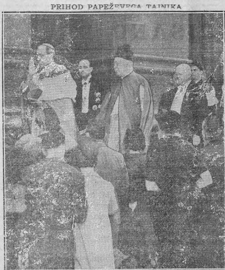
Papežev državni tajnik, kardinal Pacelli (na levi), ko blagoslovlja vernike zunaj na cesti v New Yorku, ko je v sprejedu korakal v katedralo sv. Patricija. Kardinal je prispel nedavno na obisk v Ameriko.

Telesu življenske dobrote, resnice in lepote, duši duhovno dobro, resnično in lepo. Telesu do mere in po božji zapovedi, duši pa toliko, kolikor objekti more. To je program Jezusov. Vsakemu svoje, cesarju, kar je cesarjevega, Bogu božje.