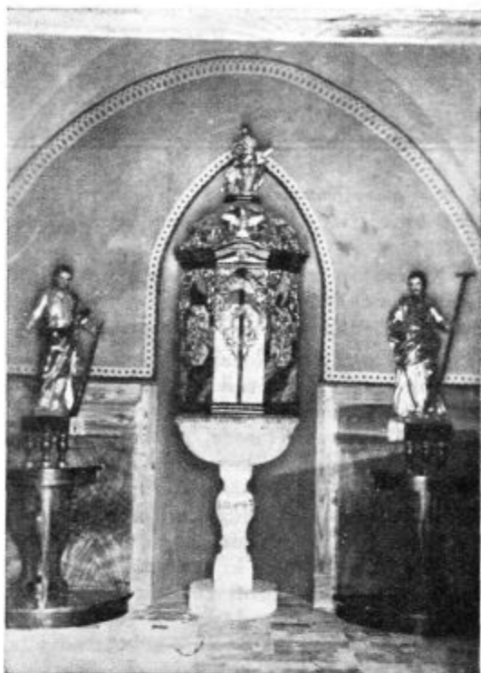
Krstna kapela v St. Gradcu

To vedó najbolj one nesrečnice, ki jim po pravici gre naslov »Herodeževske matere«. Te so krive, da je pogled v naše krstne knjige tako žalosten, te so krive, da je v mnogih osnovnih šolah toliko klopi praznih, da iz ulic naših mest zginja cvet človeštva — vedra mladina, ki edina more povsem pristno ozaljšati in oslajšati naše bedno zemeljsko življenje. Dušice nerojenih, umorjenih otrok pa pred božjim prestolom ihtijo; iz stotisoč in milijon milijonov nerazvitih ustec, ki niso nikdar izgovorila sladkega imena mati — mama, se dviga oglušujoči klic: »Maščuj našo kri, Gospod, ki je bila razlita na zemljo!« Kako bodo brezvestne žene in njih zapeljivci mogli nekoč obstati v priččo takih in tolikih tožilcev?!