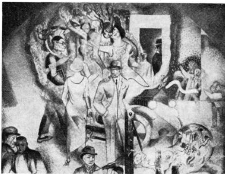
Kristus sovraži svet

Z desnico pa sega globoko doli po gošpodu z monoklom, da si še bolj podjarmi