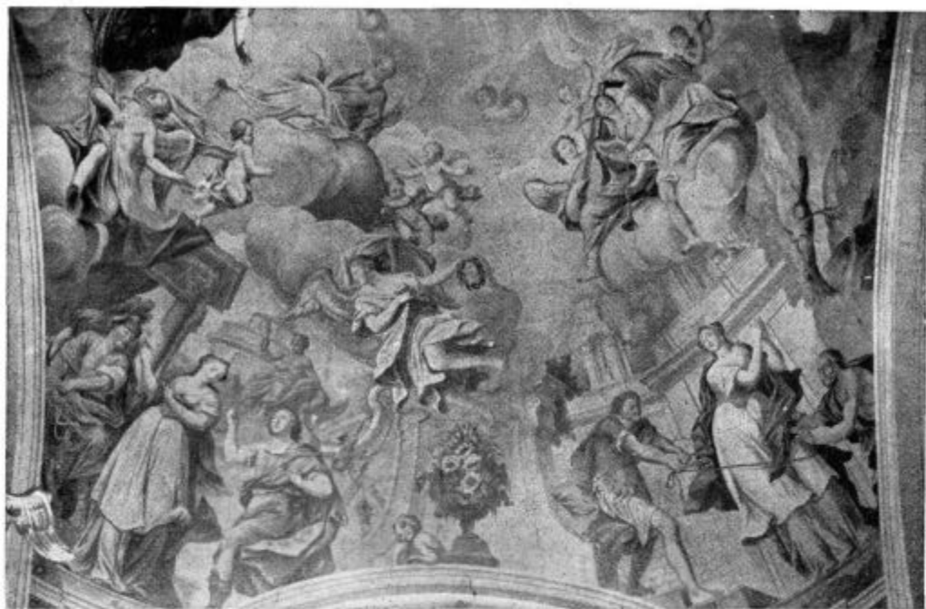
Skaručina: So. Lucija zavrne snubca. — Rablja vežeta svetnico. (Glej pojasnilo: str. 309.)

ske in poklicne dolžnosti so prve. Zato je Terezija sklenila: »Moj poklic je karmeličanski. Moje prve dolžnosti so zapisane v redovnih pravilih; spolnjevati hočem točno in vestno sleherno točko teh pravil; kajti nočem biti samo na pol svetnica, marveč velika svetnica karmelskega reda.« Mimo teh neizbežnih službenih žrtev je pa porabila vsako priliko, ki se ji je nudila — za ž r t e v. Zato si je želela preskušenj, ki so ji bile prihranjene. Ker je bila močno občutljiva, si je želela trpljenja, seveda samo v takšni meri, da bi ga z božjo pomočjo mogla obvladati. Želela si je v z u n a n j e m i s i j o n e, v nepoznane kraje, v nepoznane hiše, med nepoznane sestre, kjer bi mogla čisto pozabljena in brez vsake človeške tolažbe služiti Bogu.