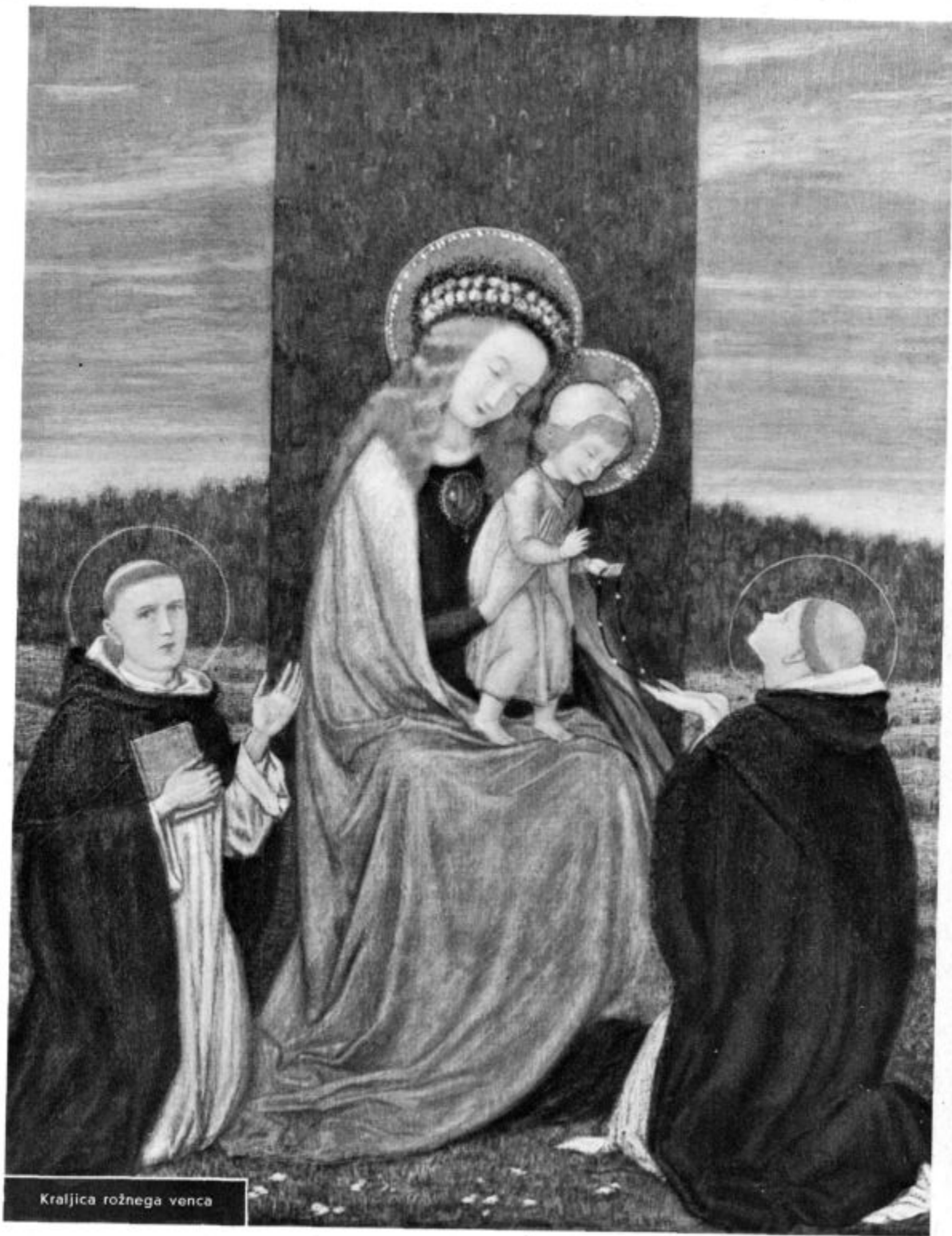
Kraljica rožnega venca