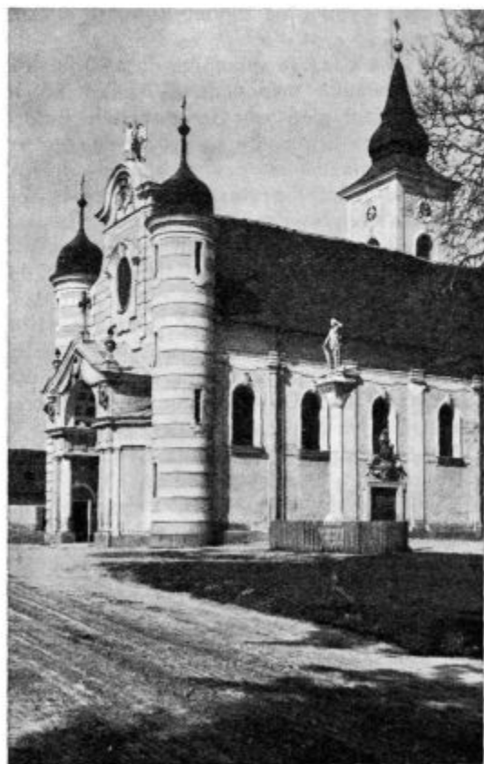
Župnijska cerkev v Beltincih