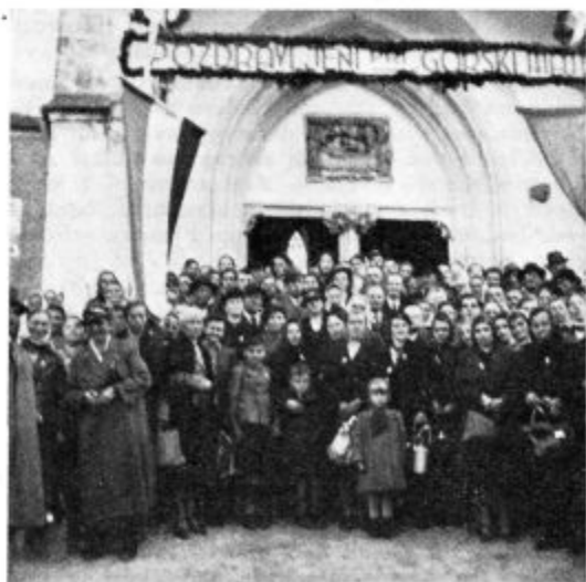
Romarji pred cerkvijo na Ptujski gori

Kakor »Kranjci« ljubijo Marijo Pomagaj na Brezjah, prav tako so »Štajerci« navezani s polnim zaupanjem na Marijo na Ptujski gori;