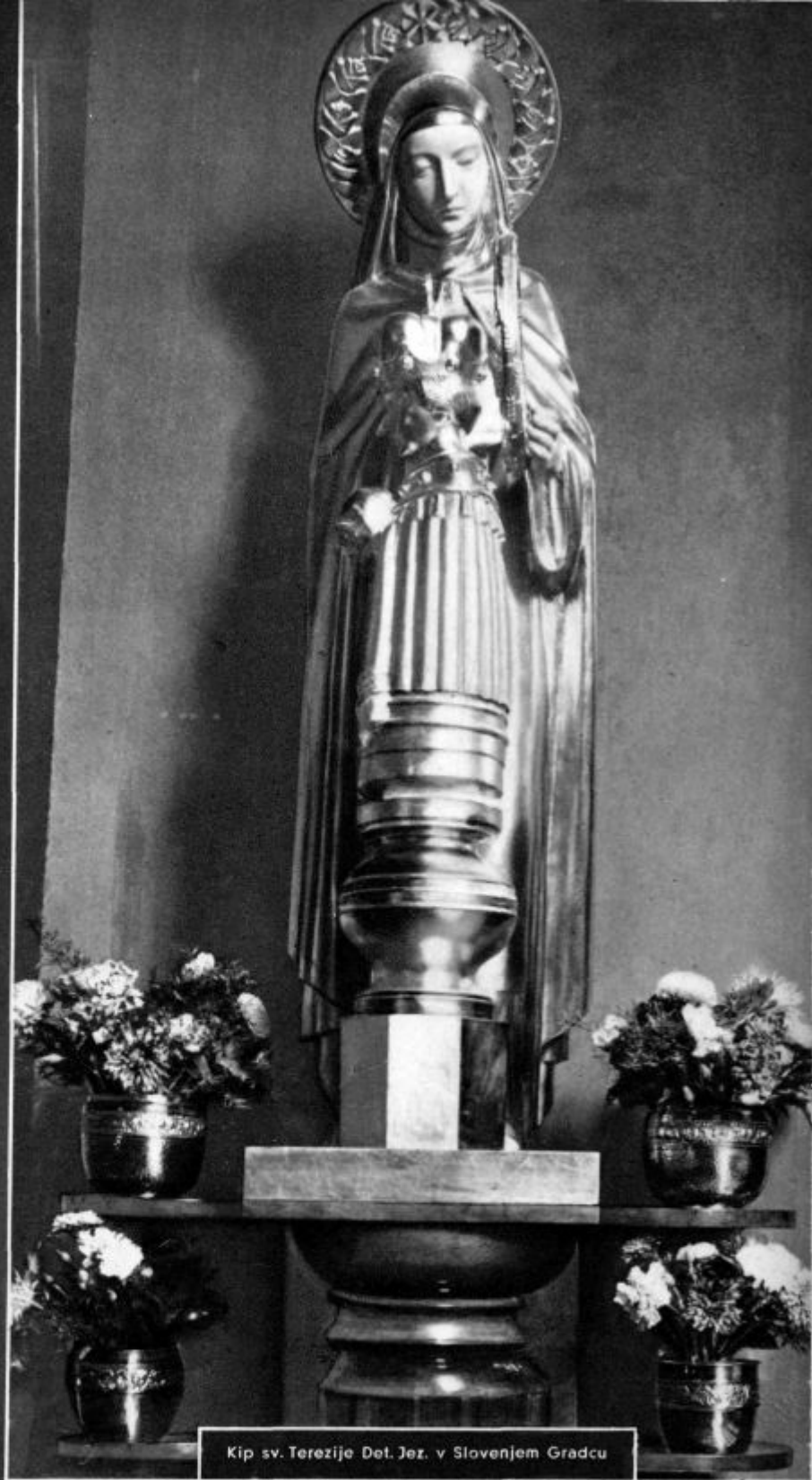
Kip sv. Terezije Det. Jez. v Slovenjem Gradcu