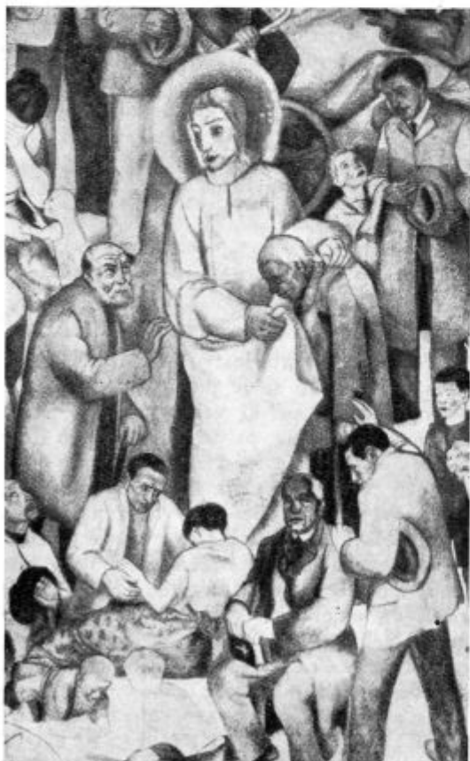
Kristus in njegovi zvesti

»Bog natrosi pticam žita, pa morajo do njega zleteti.«