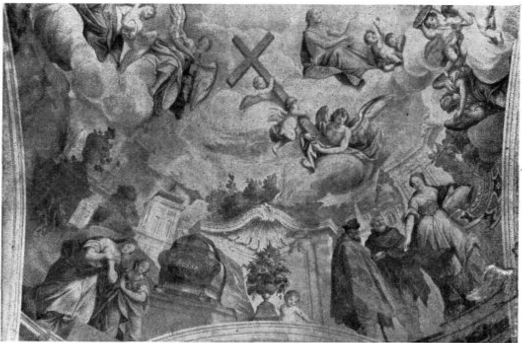
Skaručina: Sveta Lucija pri grobu sv. Agate.

V Katekizmu imate zapisano: Bog je neskončno svet. To se pravi po domače, da Bog hoče in ljubi vse dobro in sovraži vse hudo. Velikokrat beremo in govorimo o svetnikih.