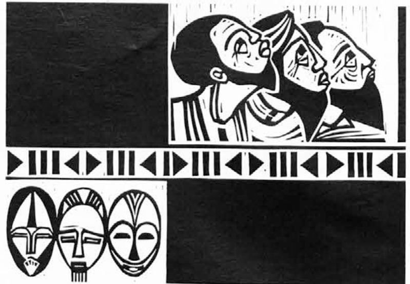
Afriška domača umetnost