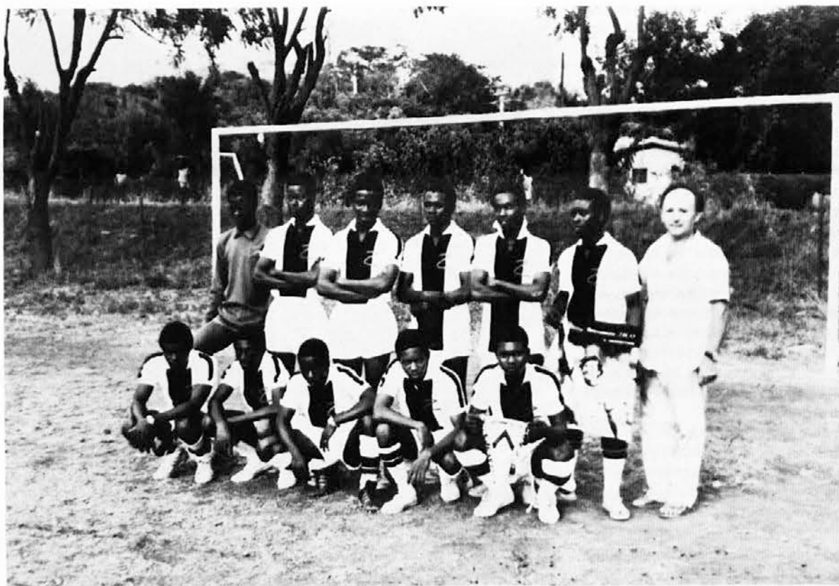
Tudi v Slonokoščeni obali radi igrajo nogomet