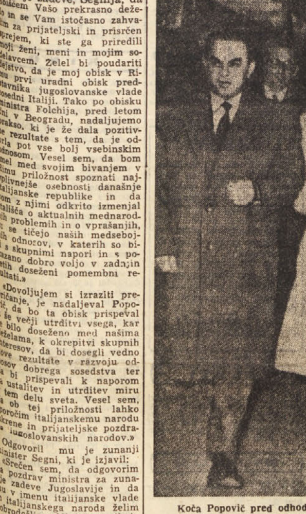
Koča Popović pred odhodom iz Beograda v Rim

VIENTIAN, 1. — Zaključena so bila danes pogajanja med sedmimi predstavniki laoske narodne skupščine in »pro-