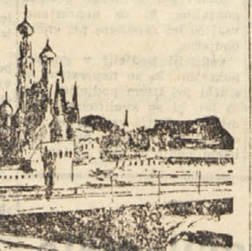
Ob 20-letnici Jugoslovanske revolucije

terimi se Moskovčani radi ustavi. Vtem ko mesto spi, v palači »Mesenego« delajo. Glavni dispečer elektroenergetike je vedno buden. Pred njim je velik pulst s kontrolnimi napravami. Če vstopno pred njim se razprostira svetlobna shema elektroenergetike, ki oskrbuje Moskvo z električno energijo. Največji oskrbovalec Moskve z električno energijo je Kujbiševska hidrocentrala na Volgi. Z močnim kablom ta centrala posreduje Moskvi vsak dan 17 milijonov kWh električne energeije.