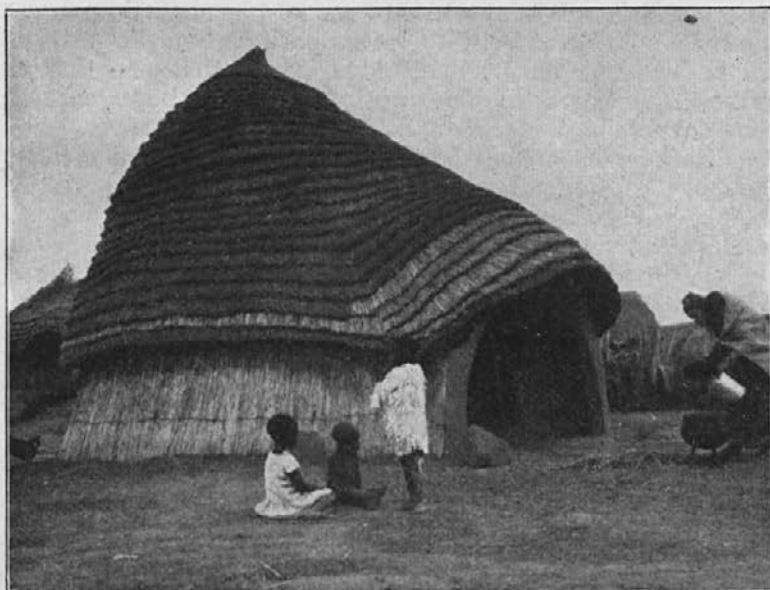
Siromašne koče zamorcev.

Ime, ki ga je neka zamorska mati dala svojemu sinku, sem uporabil za naslov temu svojemu poročilu, kajti lepšega naslova pač ne bi mogel najti. Kako svetla in čista je v svojem bistvu zamorčeva duša! Odkar sem imel priliko spoznati, s kakšno ginljivo ljubeznijo izbirajo zamorske matere — tudi poganske — svojim otrokom imena, se je moja vera v njihovo dobroto poglobila.