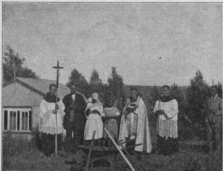
Misijonar blagoslavlja orodje za zidavo nove misijonske cerkvice.