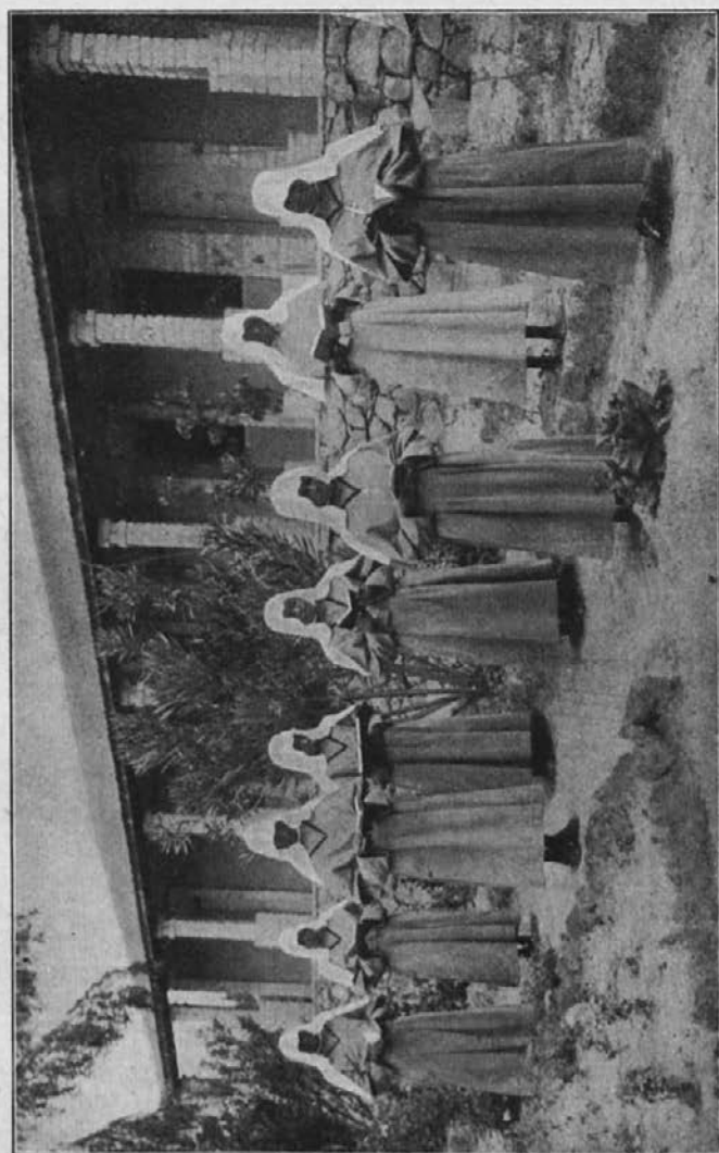
Zamorske sestre frančiškanke.