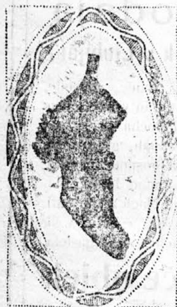
130 lastnih trgovin.

Poslovalnica „Prve ces. kr. avstrijske državne razredne loterije.“