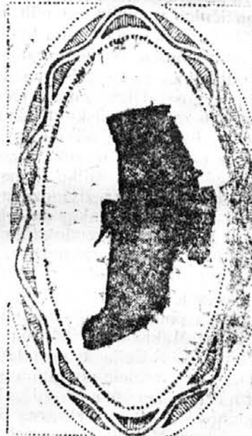
20.000 parov tedensko. 1200 delavcev in nastavljenecv.