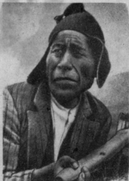
Levo: Andski Indijanci z živaljo tamošnjih strmin - lamo. Desno: Splaval na jezeru Ticcacaca, tudi Indijanec.