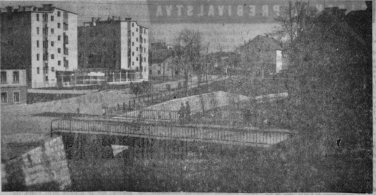
Do nedavna občinsko središče Saleške doline — Soštanj — se je tudi dokaj moderniziral. Novo naselje termoelektrarne tvori samostojno četrt. S posebnim poudarkom pa se v zadnjem času trudijo, da bi Soštanj čimbolj turistično izkoristili, saj ima s svojo lepo okolico in idealnimi izletnimi točkami vse pogoje za tovrstno dejavnost. V kolikor bo prišlo do realizacije sedežnice na Sentvid, bo Soštanj tudi v zimski sezoni interesanten za domače in tuje goste. Veliko pa bo mesto pridobilo z izgradnjo kopalnega bazena, ki bo prihodnje leto že pričakal kopanja željne domačine in goste.

Reportažni zapis je sestavil Jože Klančnik