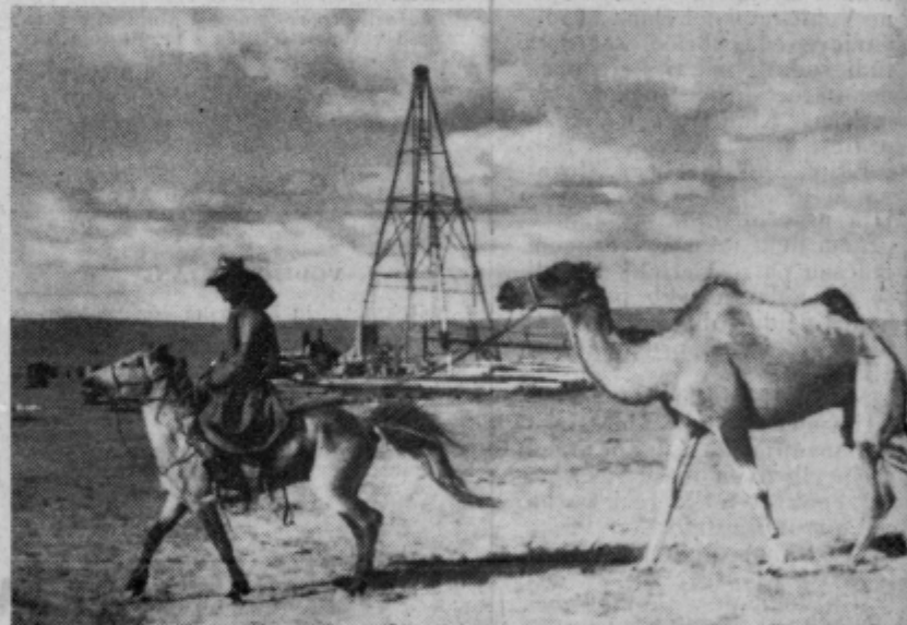
Vrtalni stolp za vodo v puščavi Gobi.

Na Bahamskih otokih v Karibskem morju so zoologi ujeli veliko tuno. Zaznamovali so jo in spustili nazaj v vodo. Po petdesetih letih so ribo ponovno ujeli v bližini norveškega pristanišča. Riba je po tolikem času preplavala pot najmanj 8000 kilometrov, kar pomeni 160 kilometrov dolžine na en sam dan.