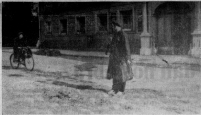
Zal, so kolesarji na cestah še vedno najbolj nepoučeni vozniki. Morda bi bilo prav, če bi boljše poskrbeli tudi za prometno vzgojo odraslih kolesarjev, kajti mladi jih marsikaj prekosijo

Predlog, ki ga je komisija izdelala, vsebuje tudi dograditev kolesarnic, obvoznic za vprege, dograditev kolesarskih stez do Vojnika in Zalca, postavitev dveh varnostnih ograd — na cesti proti Laškem in v Skofji vasi, ter še celo vrsto predlogov, ki bodo nedvomno pripomogli, da bo promet v celjskem mestu sodobnejše in varnejše potekal.