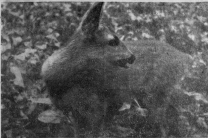
Srnice so bile že od nekdaj veliki prijatelji otrok. To velja tudi za tole, ki je prav prikupno pozirala fotografa fu.

Podobne proslave so bile tudi pri ostalih pionirskih odredih v celjski občini. Če sodimo po nekaterih poročilih, ki smo jih o tem dobili v uredništvo, so pionirji naše občine svoj praznik res lepo in slovesno preživel.