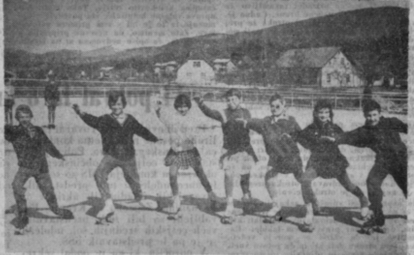
Skrb za mladino je vedno na prvem mestu. Zal mnogokrat kljub najboljšim željam ni mogoče vsega ustreti, vendar pa ima velenjska mladina dovolj možnosti za razvedrilo. Nova kotlarsko igrišče je danes že prizorišče nastopov domačih kotlarkarjev, ki bodo v počastitev občinskega praznika dali samostojno revijo. To je vsekakor uspeh, če vemo, da je klub zaživel šele pred nekaj meseci.