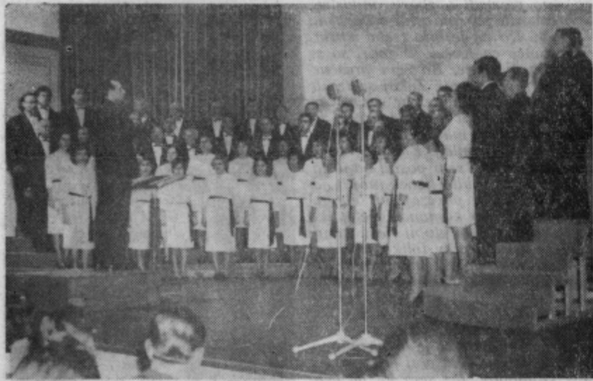
Večer, ko so v Celju nastopali makedonski ansambli, je bil pravo doživetje za ljubitelje umetne in narodne glasbe

Vsekakor je problem strokovnega in tehniškega šolstva toliko pomemben, da zasluži javno razpravo vseh družbenih činiteljev, kajti rešitev ni in ne more biti zgolj v samih šolah. Kl.