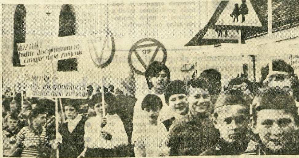
»PROMETNO VZGOJO V SOLE« je geslo zvezne prometno-vzgojne akcije, ki bo trajala od 15. septembra do 15. decembra letos. V četrtek popoldne je okrog 1500 osnovnošolskih otrok po kranskih ulicah v povorki z zastavicami in prometnimi znaki simboliziralo pričetek te akcije

Tudi v mejnem pasu prost dostop v planine