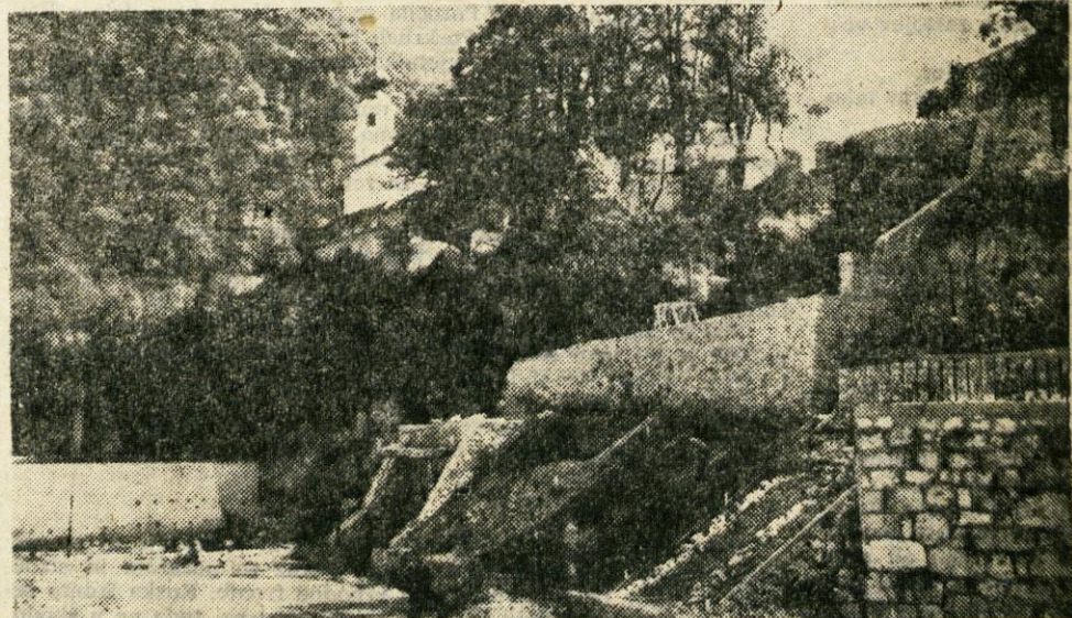
V Kamniku v zadnjih dneh urejajo Mali grad in okolico; utrjujejo in urejajo breg nad kamnino, da bo izgled lepši in da se zemlja ne bo posipala, postavili pa so tudi nekaj reflektorjev, da bo ta pomembni kulturno-zgodovinski spomenik ponoči razsvetljen. Urejen Mali grad bo v Kamniku pomembna turistična privlačnost

JESENICE: posvetovanje o financiranju izobraževanja — Na posvetovanju, ki je bilo v petek prejšnji teden in ki se ga je udeležilo več kot 50 predstavnikov šolskih zavodov, prosvetnih in družbeno-političnih organizacij, so se v živahni razpravi izluščila tri vprašanja v zvezi z osnutkom novega zakona o financiranju vzgoje in izobraževanja, in sicer: 1. Koliko sredstev za vzgojo in izobraževanje bo prinesel nov sistem financiranja? 2. Kaj vse naj bi financirali iz teh sredstev? 3. Kdo naj upravlja s tem denarjem? Ali občinske izobraževalne skupnosti ali širše regionalne izobraževalne skupnosti? Na posvetovanju je bila imenovana posebna petčlanska komisija, ki bo iz razprave izluščila zaključke in jih ponovno dala v javno razpravo. Te zaključke bo komisija poslala tudi pristojnim republiškim organom.