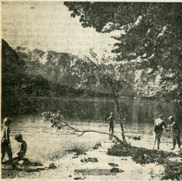
Po poletju v znamenju dežja smo na pragu jeseni, ki je v Bohinju posebno lepa in od katere letos veliko pričakujemo kar se vremena tiče. Kopalci zapuščajo blejsko in bohinjsko jezero, turisti pa še ne