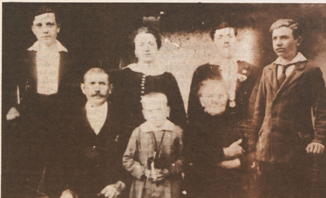
Del Vovkove družine