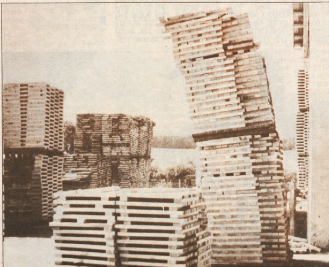
Stolp v . . .