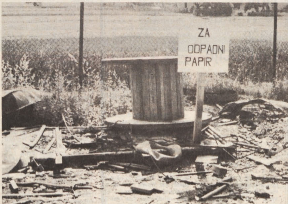
Za odpadni papir in še ...

2. kandidati, ki imajo srednjo šolo nelesarske smeri ali nižjo izobrazbo morajo opraviti preizkus znanja iz zgoraj navedenih predmetov ter imeti pet let delovne prakse na področju lesarstva.