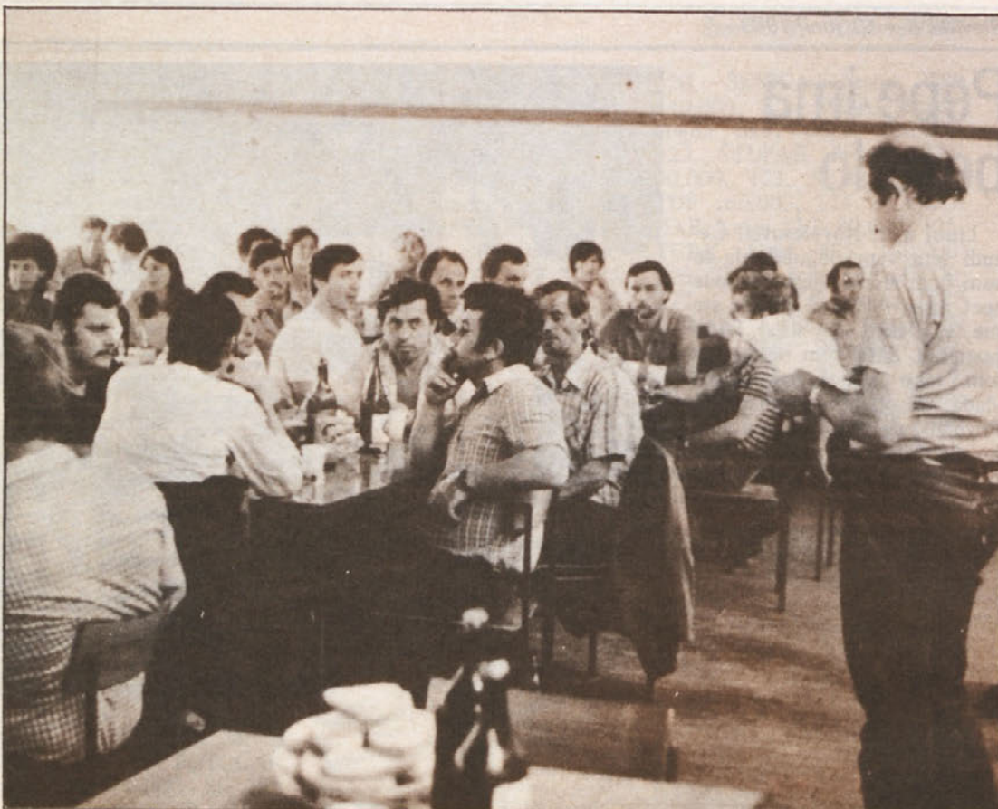
Minuli teden je bilo v Straži organizirano srečanje krvodajalcev DO Novoles. Ob tej priložnosti so bila podeljena tudi priznanja za večkratno darovanje krvi. Več o tem v naslednji številki.

Glasiło „NOVOLES“ ureja uredniški odbor. Odgovorni in tehnični urednik Vanja Kastelic. Izdaja delovna organizacija „NOVOLES“, lesni kombinat Novo mesto — Straža. Naklada 2950 izvodov. Stavke, filmi in montaža: DITC, TOZD Dolenjski list. Tisk: DITC, TOZD Tiskarna. Glasiło je oproščeno temeljnega prometnega davka na podlagi mnenja Sekretariata za informacije pri IS SR Slovenije št. 421/72 z dne 31. januarja 1978.