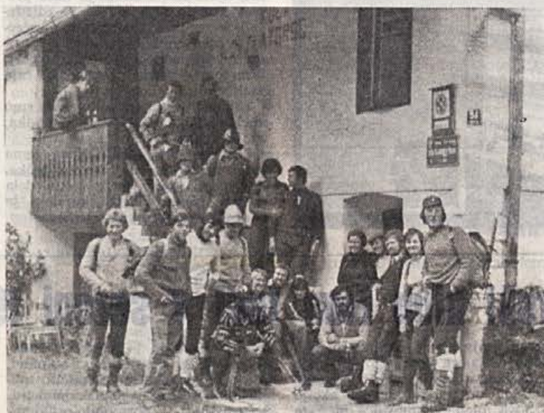
Ko smo v Trenti čakali avtobus, je marsikoga skrbelo, kako bo spravil »mačka« skozi vrata avtobusa...