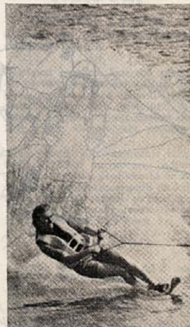
Slalom — najlepša disciplina smučanja na vodi