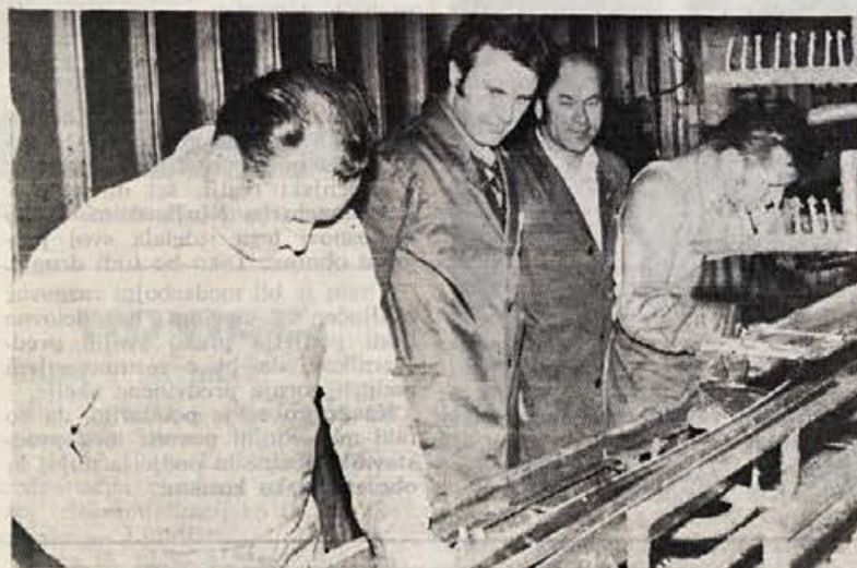
Glavni direktor se zanima za delo v smučariji, v hall »B«.