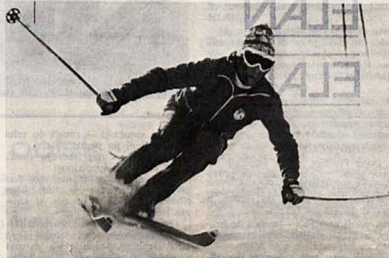
Stenmark med vožnjo z našimi smučmi

smučmi postala težaven podvig. Potem je poleti prišlo do dražbe. Stenmark je prejel na desetino ponudb. Ostal je zvest svoji stari smučarski hiši Elan-u, a v njem je prišlo do prebujenja. Danes Stenmark