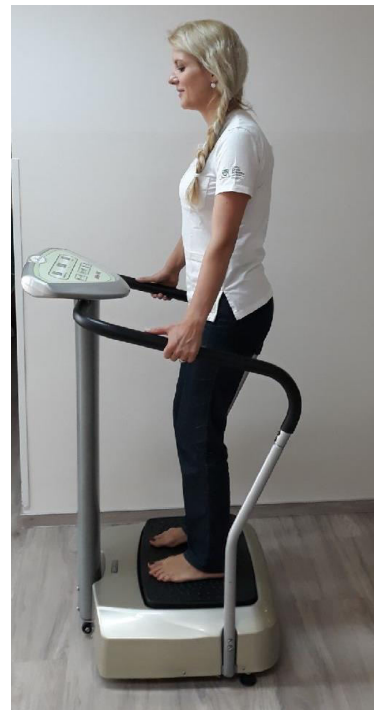
Slika 1: Sinusoidna vibracijska plošča

Pred kratkim so se poleg sinusoidnih naprav s stalno frekvenco vibracije pojavile tudi naprave z vibracijo stohastične resonance. Razlika med njimi