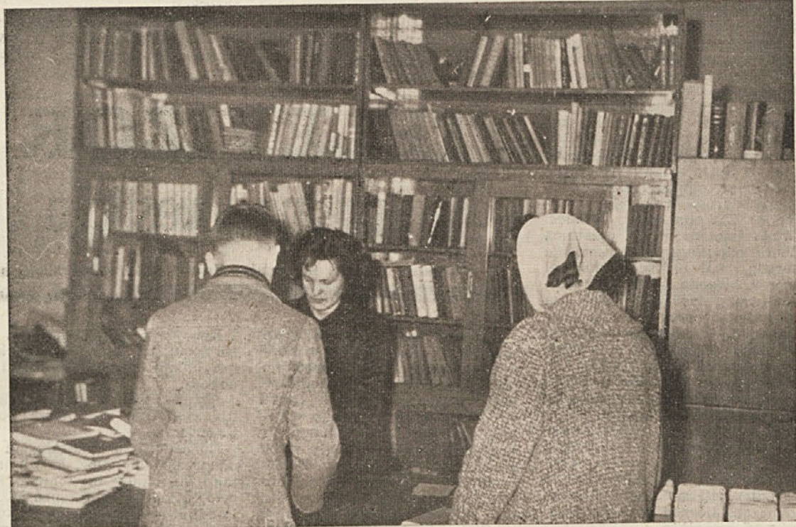
V knjižnici Kočevje

njih živeli, se učili in plemenitili svojo miselnost o življenju ljudi vsega sveta. S temi deli so potovali po vseh kontinentih naše zemeljske oble, pluli so po oceanih, potovali po pragozdovih, sodelovali so v bitkah starega, srednjega in novega veka skratka živeli so življenje ljudi, ljubezni in sovraštva, ki ga je imel človek v zgodovini svojega obstoja. Iz vsega tega so spoznavali odnose med ljudmi, ki so se razvijali v teku stoletij. Oblikovali so svojo notranjo stran človeka, ki je vedno dostopna za lepoto življenja, za tisto srečno dobo, v kateri bi bili vsi ljudje srečni in veseli, dobo, v kateri se ne bi bali za obstoj svojega življenja.