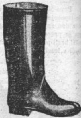
Za troke. Za zimo in slabo vreme. Varujejo noge mokrte tudi ob najslabšem vremenu.