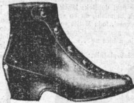
Zenske snežke, črne in rjave, z visoko in nizko peto. Prodajamo jih z jamstvom za vsaki par.