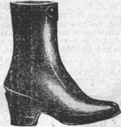
Zenski polvisoki gumasti čevlji s toplo podlogo. Noge so videti v njih jako elegantno.