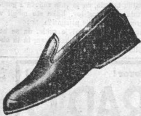
Prvovrstne moške galoše za dež, sneg in blato. Jamčimo za vsaki par.