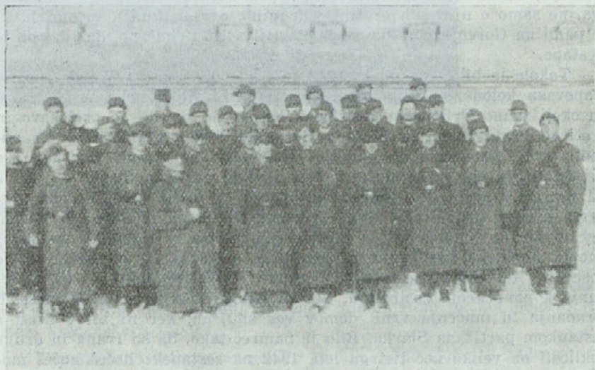
Starešinski tečaj gorenjskega domobranstva na gradu E:do pri Kranju