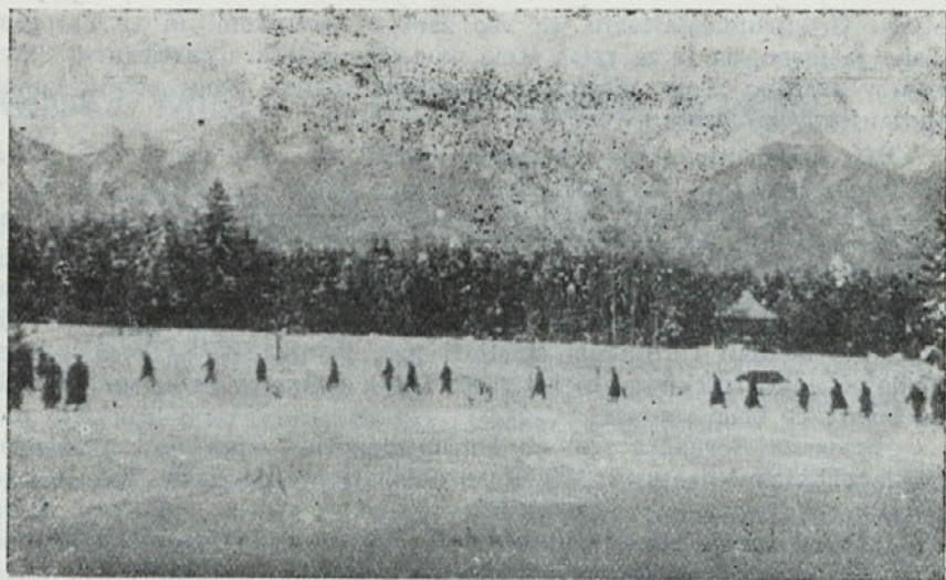
Starešinski tečaj na pohodu

ki so vztrajali na svojem čistem slovenstvu. To vsi vemo, to trdimo. Manjkajo samo zapisani potrebni dokazi. Zato z njimi na plan!