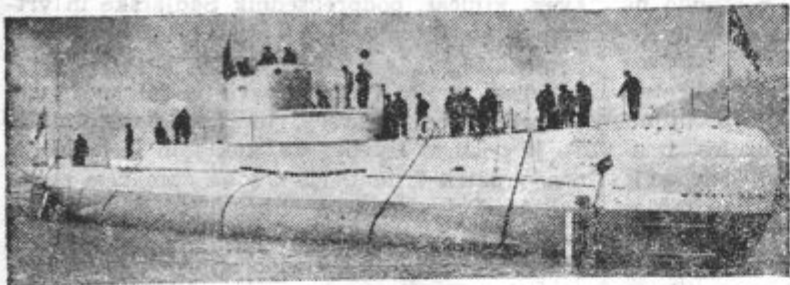
Levo: Angleška podmornica »Stonfish«, ki je bila potopljena v nemških vodah. — Desno: Polarni psi na finskem bojišču