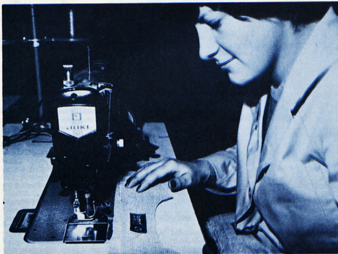
Ta bluza z oznako Labod nastaja v TOZD LIBNA.