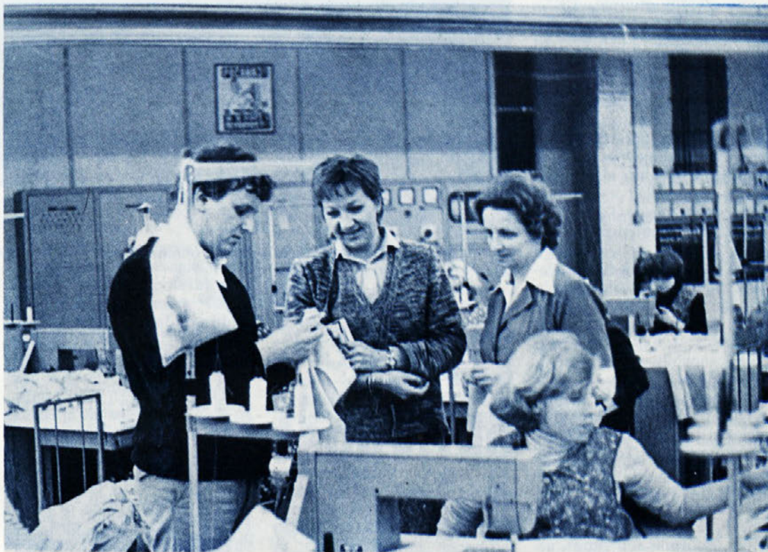
Glavni kontrolor za program „perilo — šport“, skupaj s kontrolorko in brigadirko TOZD DELTA. Redno spremljanje kvalitete izdelave je velik porok za uspeh.

Prva od nalog v tej smeri, ki so si jo v Delti zadali, je še natančnejše informiranje kolektiva o rezultatih gospodarjenja. Okvirne ocene naj bi bile