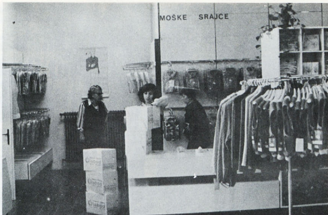
Notranost naše najmlajše prodajalne je prijetna in vabljava.