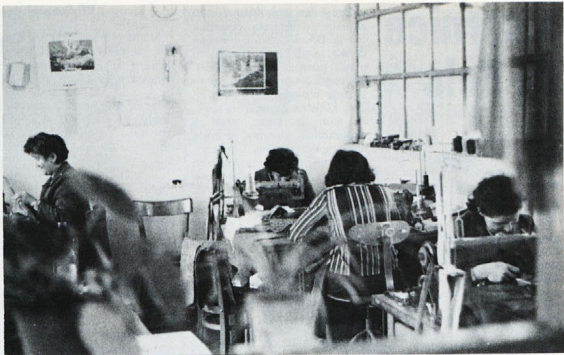
Ženski del „oddelka po meri“ v TOZD TIP–TOP.