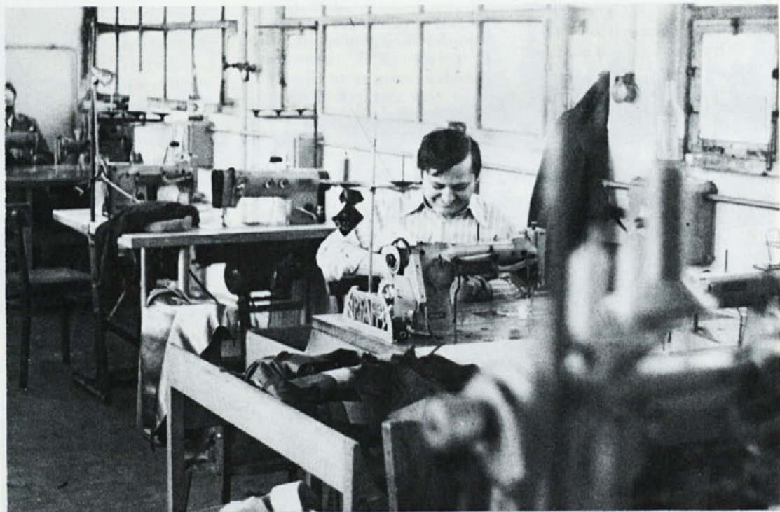
Vse več je zanimanja za usluge, ki jih hitro in kvalitetno nudi „oddelek po meri“. Posnetek je iz delavnice moških oblačil.

Vse več je zanimanja za ta naš oddelek po meri, saj sta kvalitetna in hitra izdelava najboljša priporočilo in porok, da se stranke ob prihodnji sezoni zopet vračajo.