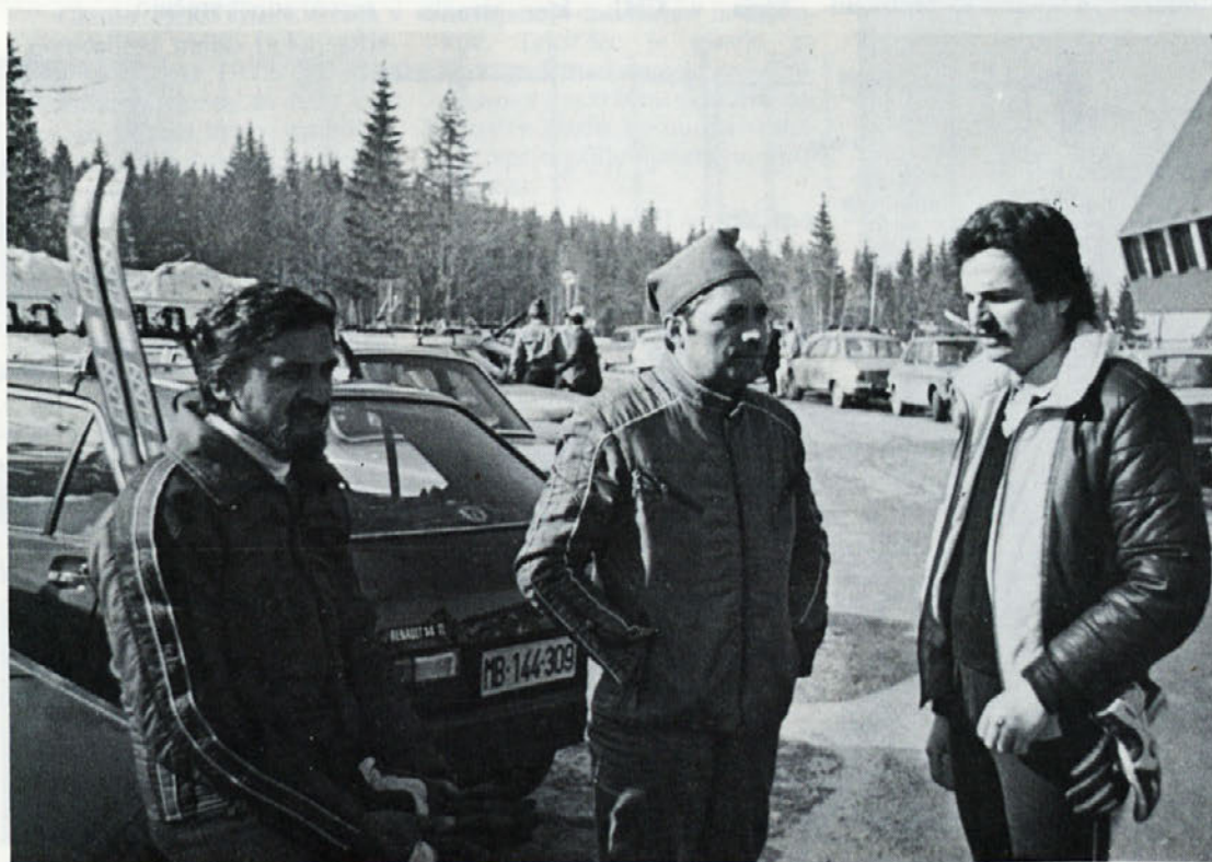
Člani društva DITTS naj bi bili iniciatorji inovatorstva v naši delovni sredini

Na sestanku so člani predelali tudi pravilnik o inovatorstvu, dane pa so bile tudi določene spremembe in dopolnila za v bodoče.