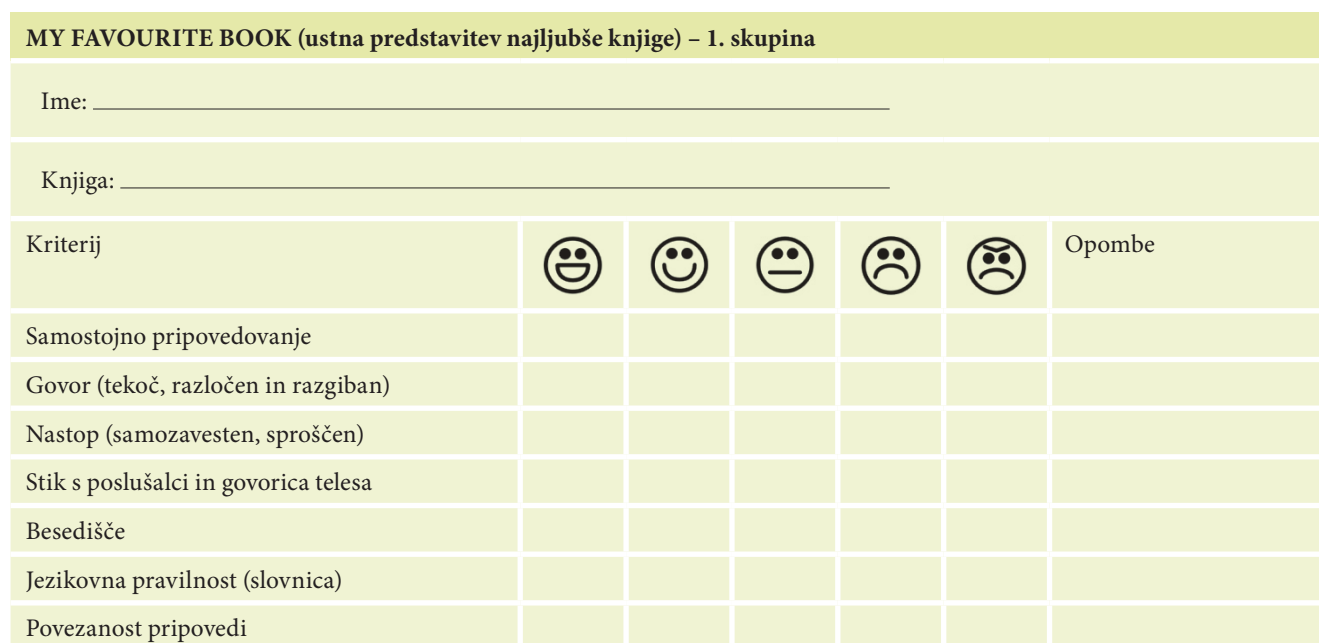
Tabela 3: Primer rubrik.