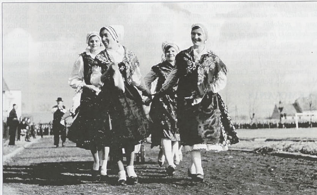
Cvet novovaških in markovskih deklet kot kopianjarice iz leta 1967.