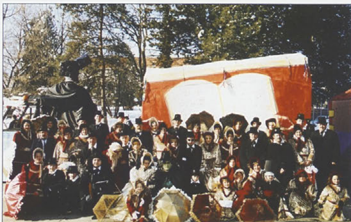
Skupina Prešernov iz stojnskega Sigeta je bila prvonagrajena v Markovcih, Dornavi in na Ptuj.

Poleg domače osnovne šole ter skupin korantov in etnografskih pustnih likov – rus, melik, picekov, kōrik, kopjašev, oračev, vil, gostovajncov in medvedov – je v Markovcih nastopilo tudi okrog 30 karnevalskih pustnih skupin. Na čelu markovske povorke so tudi