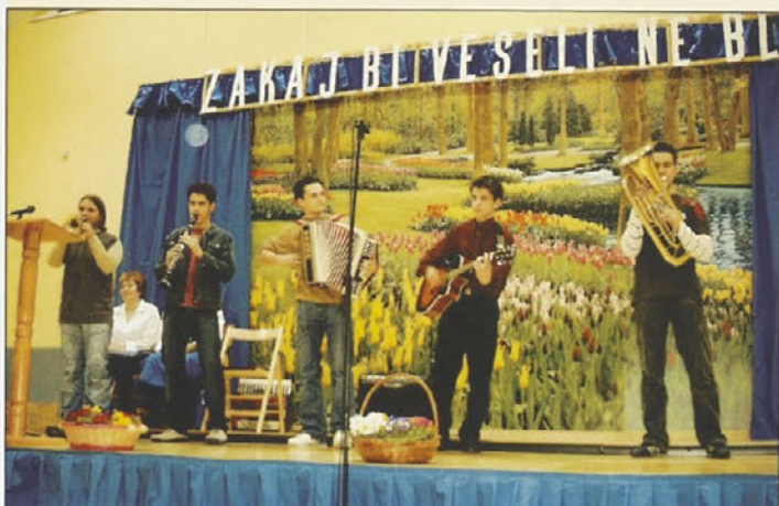
Na bukovskem odru so zaigrali tudi mladi domačini.