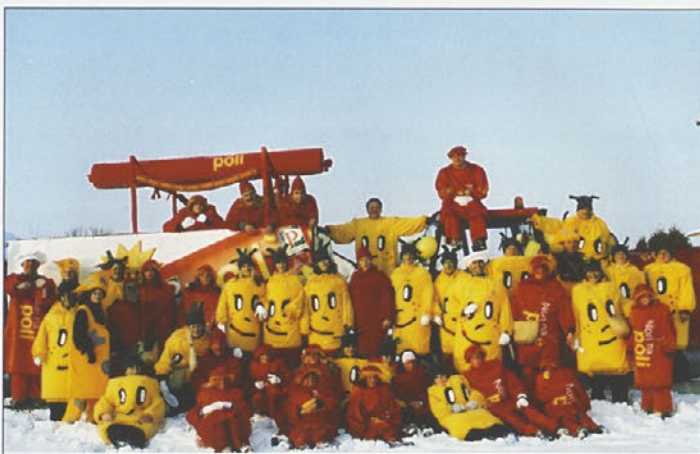
Bukovčani so se našemili v Pe-peje in klobase Perutnine Ptuj.