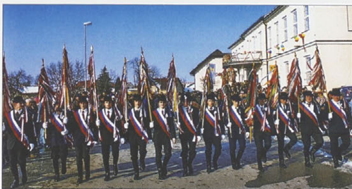
Tradicijo svojega okolja ohranjajo tudi markovski kopjaši.