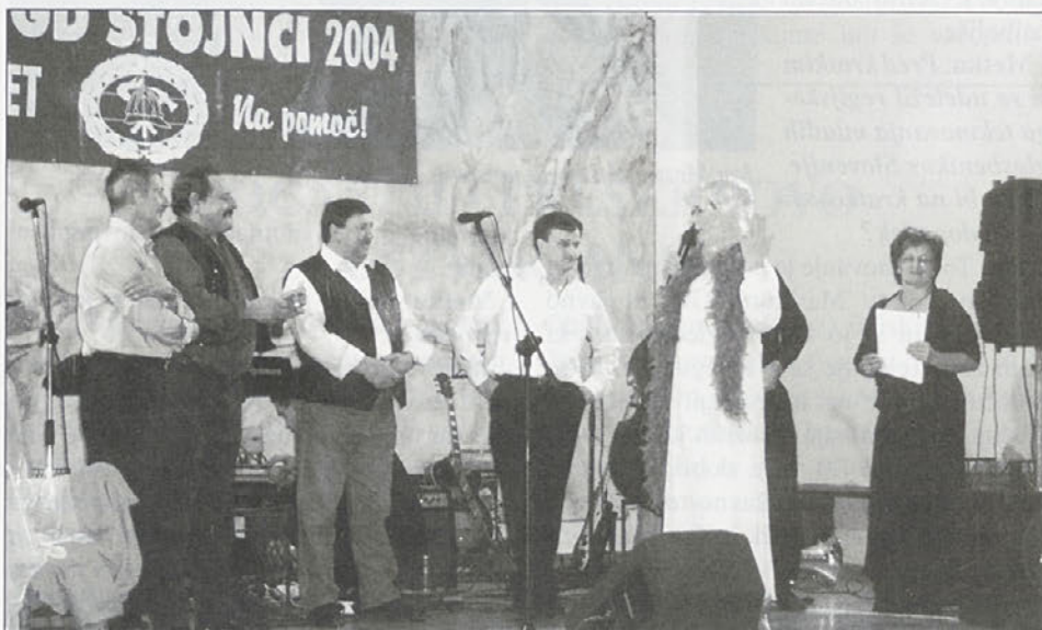
Sanjska ženska v jutranji opravi začenja s preizkušanjem kandidatov.

Sanjska ženska se je zbranim predstavila v treh različnih toaletah: roza spalni srajci, drzni popoldanski opravi in svečani večerni toaleti. Da je stojnska sanjska ženska nabrita z vsemi možnimi zvijačami, ni potrebno posebej poudarjati. Petim kandidatom je med svojim zabavnim programom zastavljala domiselne naloge, na podlagi katerih je ob zaključku večera