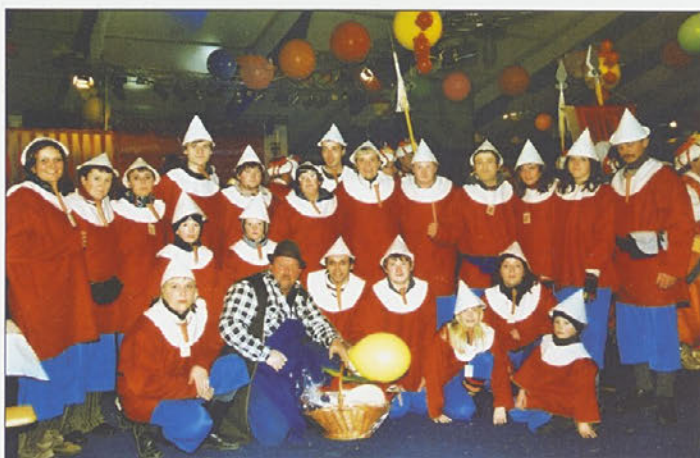
Ostržki iz Bukovcev