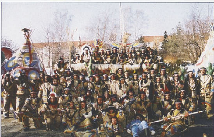
Indijanci iz stojnske Jame