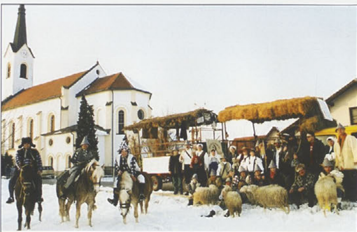
Nova vas je letos predstavljala zgodbo o Kekčevih ukanah.

letos nastopali domači godbeniki, med karnevalskimi pustnimi skupinami pa zagotovo velja ponovno izpostaviti vas Stojnci, ki se je na povorki predstavila s kar petimi pustnimi skupinami: turški harem, cirkus, indijanci, Prešerni in Julije ter kmetija prihodnosti. Bukovčani so se letos predstavili kot Pe-Peji Pertunine