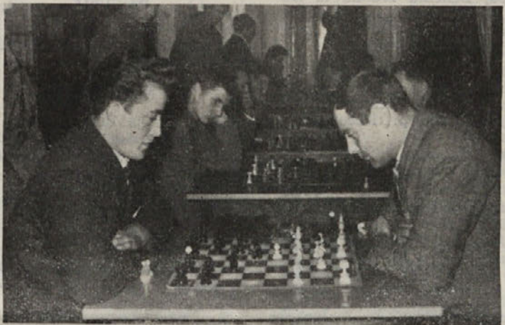
Minulo nedeljo so se v Ribnici pomerili ribniški šahisti in šahisti Kovinskega podjetja iz Ljubljane. Igrali so na 10 deskah, rezultat pa 8:2 za Ribnico

Hruščov je tudi omenil, da sta na pojedini navzoča tudi dva bodoča kozmonavta: moški in ženska.