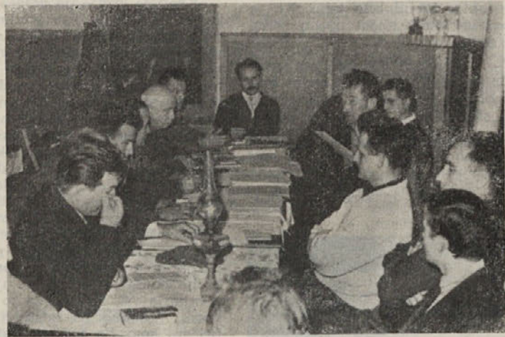
V soboto in nedeljo so v koči pri Francetovi jami pri Ribnici zborovali slovenski jamarji.

ter bili gostje poljskih jamarjev. Člani posameznih odprav v tujino so seznanili člane UO o svojih vtisih in izrazili potrebo, da se sodelovanje z jamarji tujih držav še bolj utrdi. V naslednjem letu bo verjetno odpotovala skupina slovenskih jamarjev na dvajsetdnevno potovanje v Turčijo in Libanon na ogled jam. Nujna povezava s tujimi jamarji pa je bila poudarjena zlasti zaradi tega, ker bo leta 1965 v Jugoslaviji mednarodni kongres speleologov. Prav tako pa bodo slovenski jamarji zamenjali razstave s področja jamarstva z nekaterimi drugimi državami. M. M.