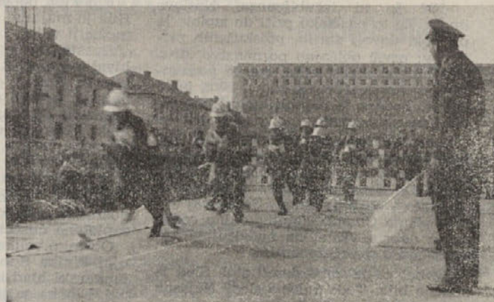
Le izurjeni gasilci so kos nalogi v primeru požara ali ostalih elementarnih nezgod, prav zaradi tega se v gasilskih vrstah izpopolnjujejo gasilci. — Eno izmed tekmovanj v Ljubljani.

Tajno poročilo ameriške administracije za astronautiko navaja na mišljenje, da je pravi čudež, ker je kozmonavt Gary Cooper pri vesoljskem poletu ostal živ. Posamezni deli projekta Mercur in oprema so bili polni napak. V dokumentu, ki so ga pred kratkim objavili za javnost, navajajo, da polovica izdelanih delov ni delovalna tako kot bi morala in da je povprečno vsaka kapsula imela okoli 500 defektov. Povprečno v vsakem izmed šestih vesoljskih poletov s človekom po 10 naprav ni moglo delovati. Najhujšemu so se astronauti izognili le z ročnim krmarjenjem in s svojimi sposobnostmi.