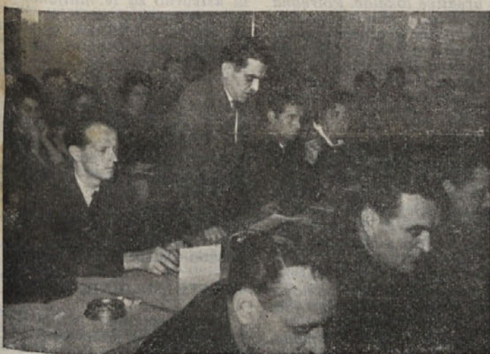
Z OBČNEGA ZBORA ObSS KOČEVJE

precej slušateljev, zato naj bi delovne organizacije izredne šolarje nagrajevale za opravljene